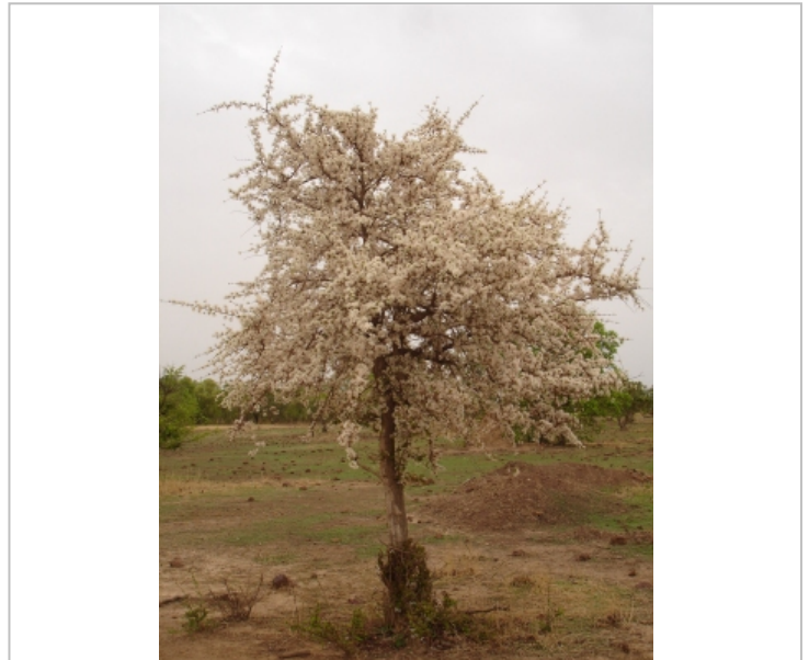
Arbre en fleurs

Photographie par: Karen Hahn-Hadjali: Plantes africaines - Guide photo