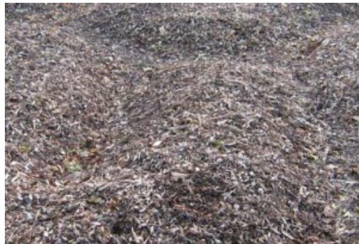
Bois Raméal Fragmenté (BRF)

Bien qu'inexpérimenté en la matière (je vais faire mon premier essai cette année), j'ai choisi de vous parler ici de BRF. Cette technique innovante d'enrichissement du sol (mais pas seulement comme nous allons le voir plus loin) a, j'en suis persuadé, un bel d'avenir devant elle.