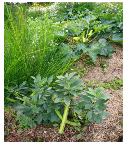
Photo de gauche, Mai 2012 : autour des buttes couvertes, les plantes spontanées s'installent.