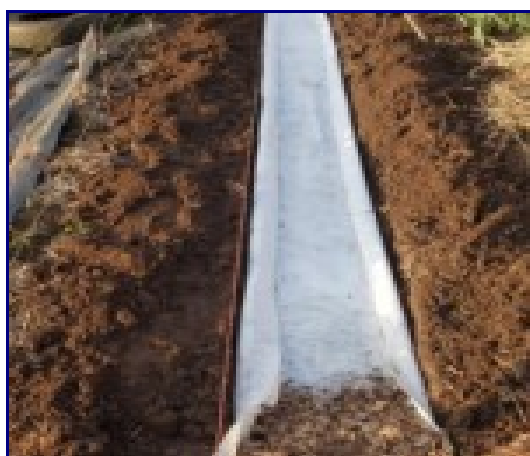
Je pose le géotextile