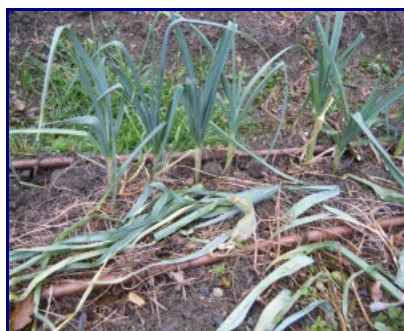
Fanes de poireaux

Sans oublier qu'à chaque fois que vous cueillez un légume (un poireau, des radis), vous pouvez au même moment enlever les parties abîmées (les pointes vertes du poireau, les fanes des radis) et les remettre sur le sol.