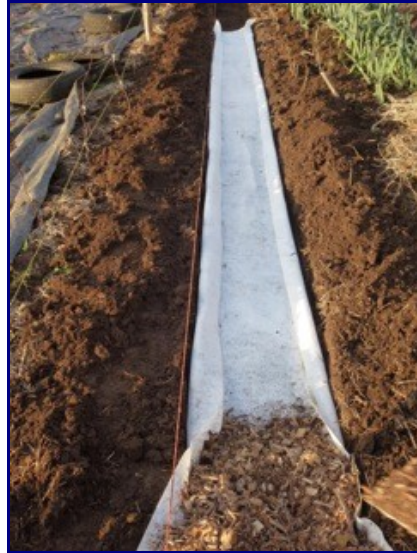
Création d'une allée de 50 cm de large entre les buttes

Je creuse des allées de 50 centimètres de largeur. Mes buttes font, elles, environ 1,20 mètre de large. Je creuse, grosso modo, sur la profondeur de la bonne terre (environ 20 centimètres). J'étale cette bonne terre sur les buttes qui de ce simple fait deviennent déjà plus riches !