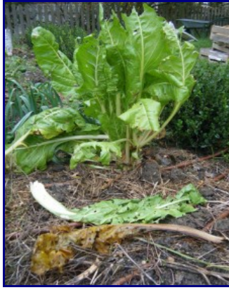
Feuilles de poirée en cours de décomposition

En fait, c'est très simple : composter en surface, c'est déposer des déchets végétaux directement sur le sol de son potager.