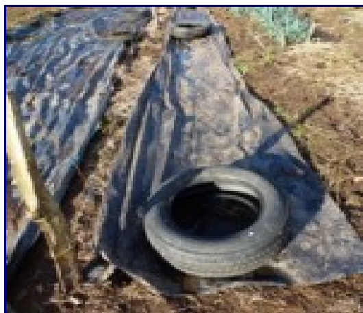
Préparation du sol