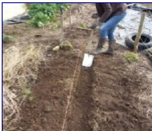
Je creuse l'allée et je mets la terre sur les buttes.