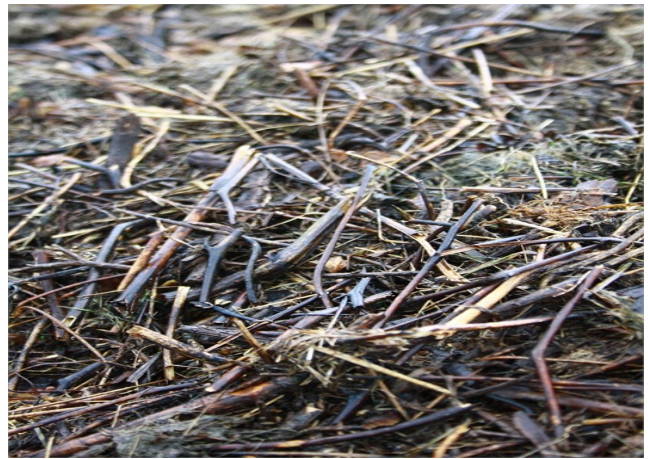
Butte recouverte d'un mix de pelouse, feuille et petites tailles de haies.