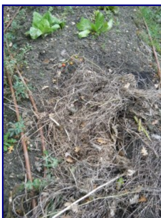
Tiges de haricots séchées

Il faut toujours veiller à ce que le sol puisse respirer . On évitera donc les paillis trop denses ou trop épais