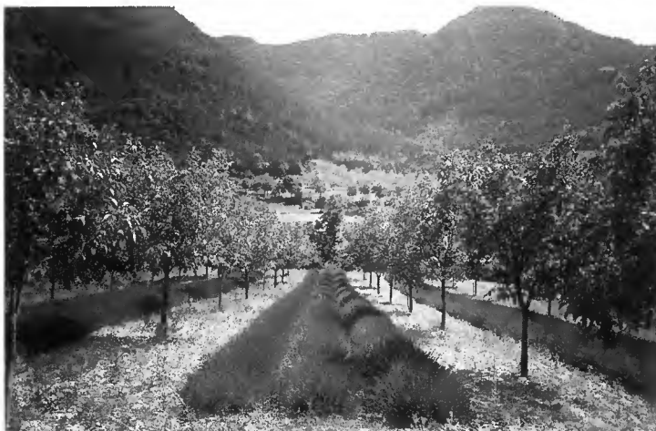
Photo 2 Culture associée noyers à fruits - lavandin dans le Diois (Drôme provençale).