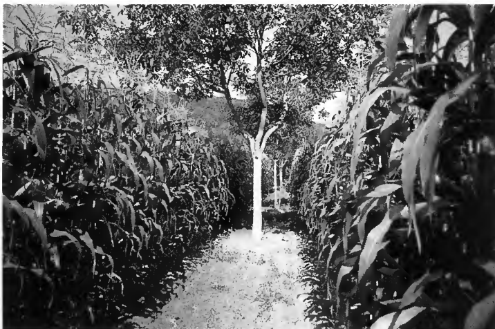
Photo 1 Culture associée noyers à fruits - maïs dans la vallée de l'Isère.