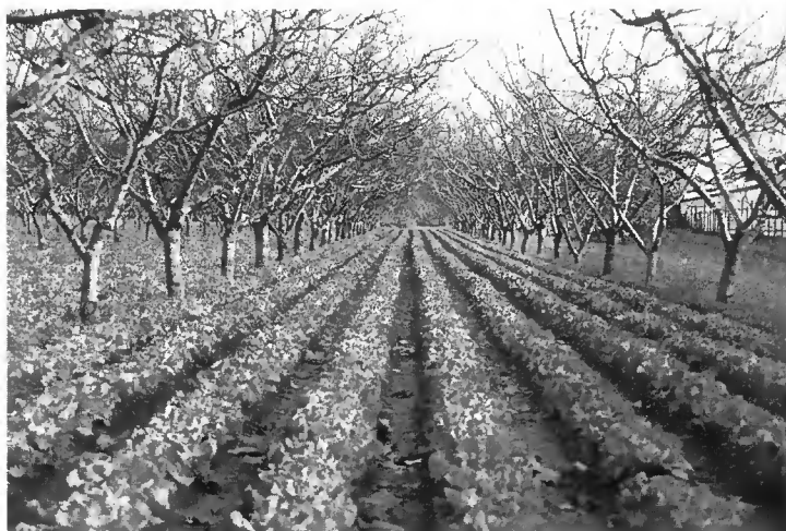
Photo 3 Culture intercalaire de salades dans un verger de pêcheurs du Roussillon. Ici la proximité des arbres et des cultures impose une mécanisation au motoculteur.