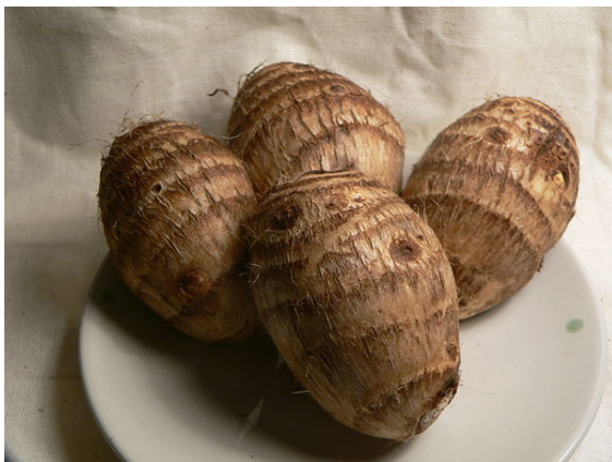
La partie comestible du taro

Le taro est apprécié en Afrique occidentale, en Chine, en Polynésie, dans les îles de l'océan Indien et dans les Antilles. La récolte mondiale avoisine 9,2 millions de tonnes (FAO 2002), les principaux producteurs étant le Nigeria, le Ghana, la Chine et la Côte d'Ivoire.