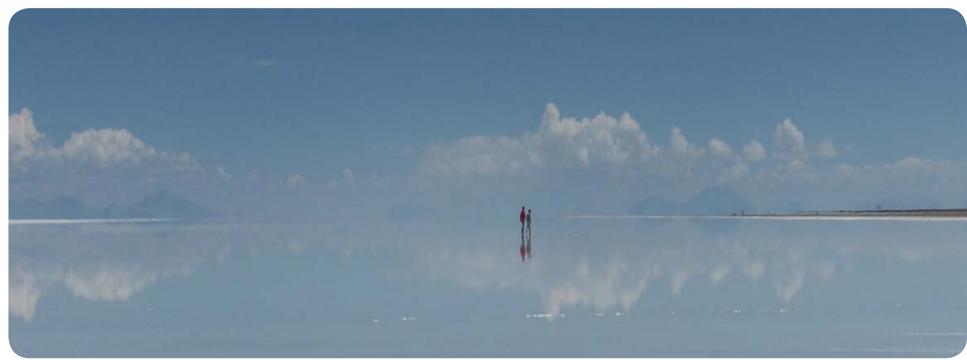
... à la surface éblouissante du Salar d'Uyuni