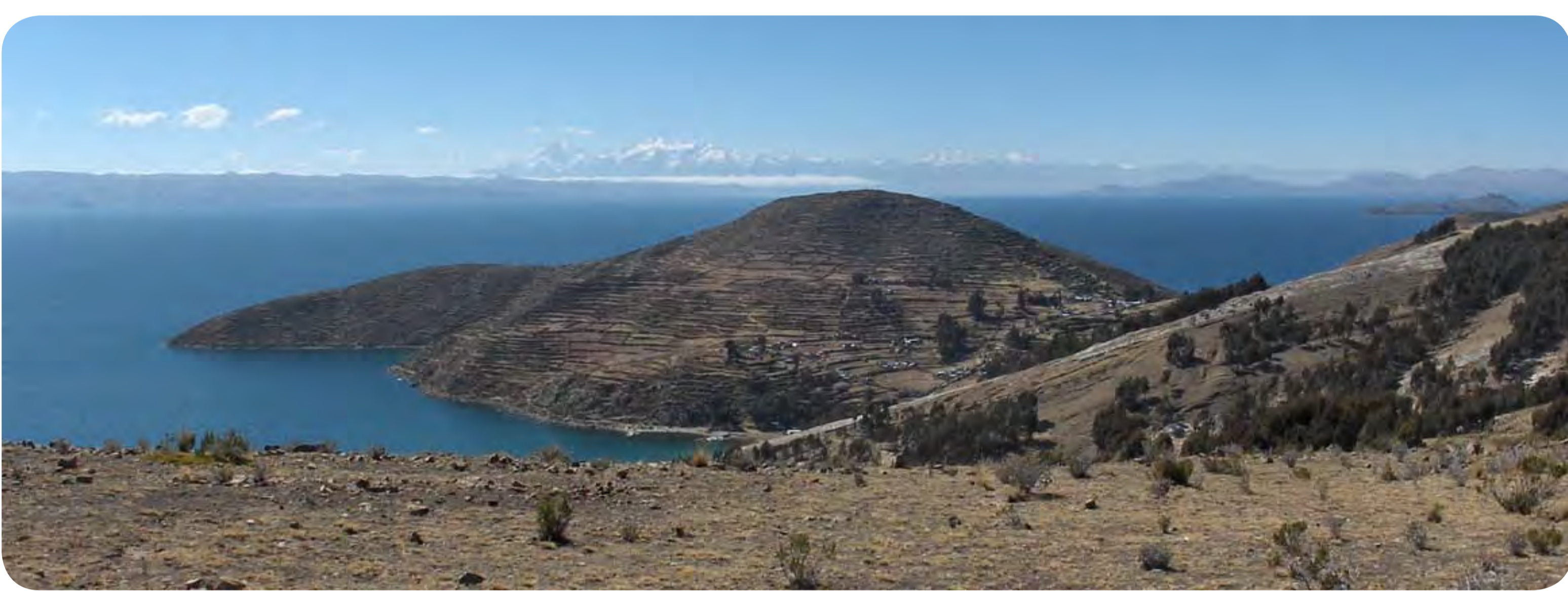
Des rives fertiles du lac Titicaca...