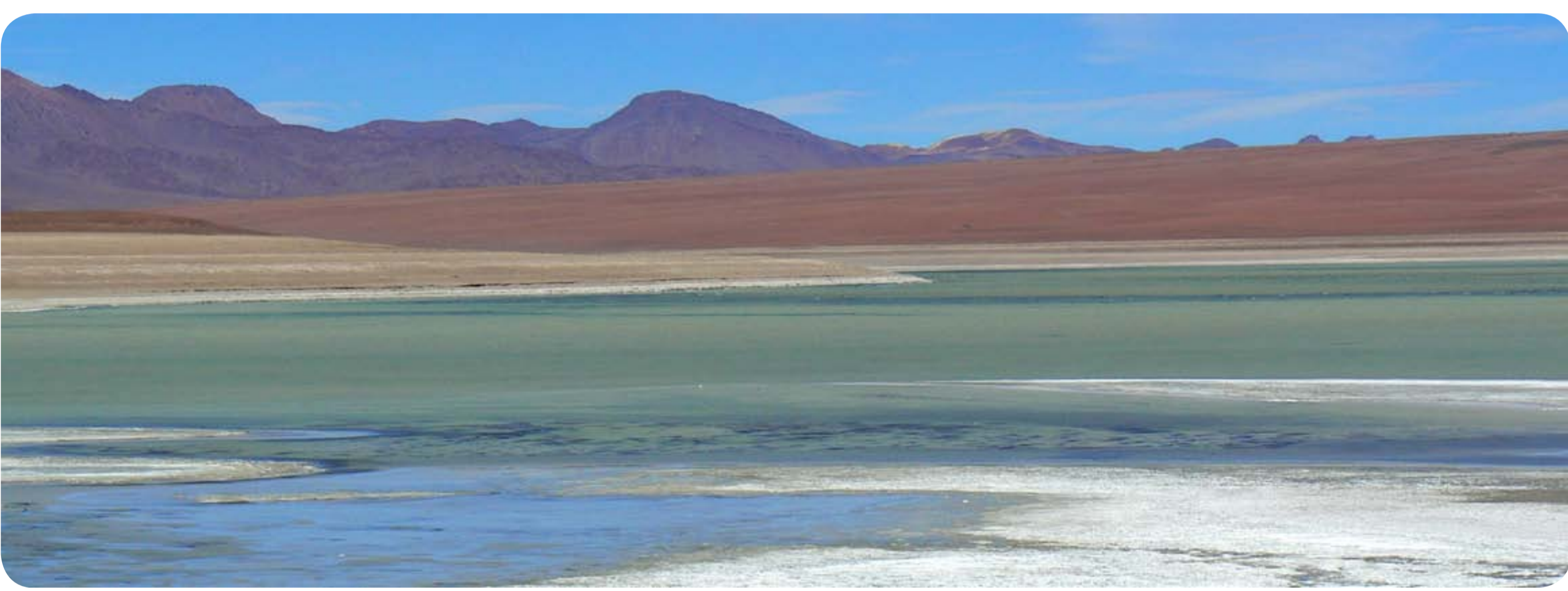
Des volcans de la cordillère occidentale...