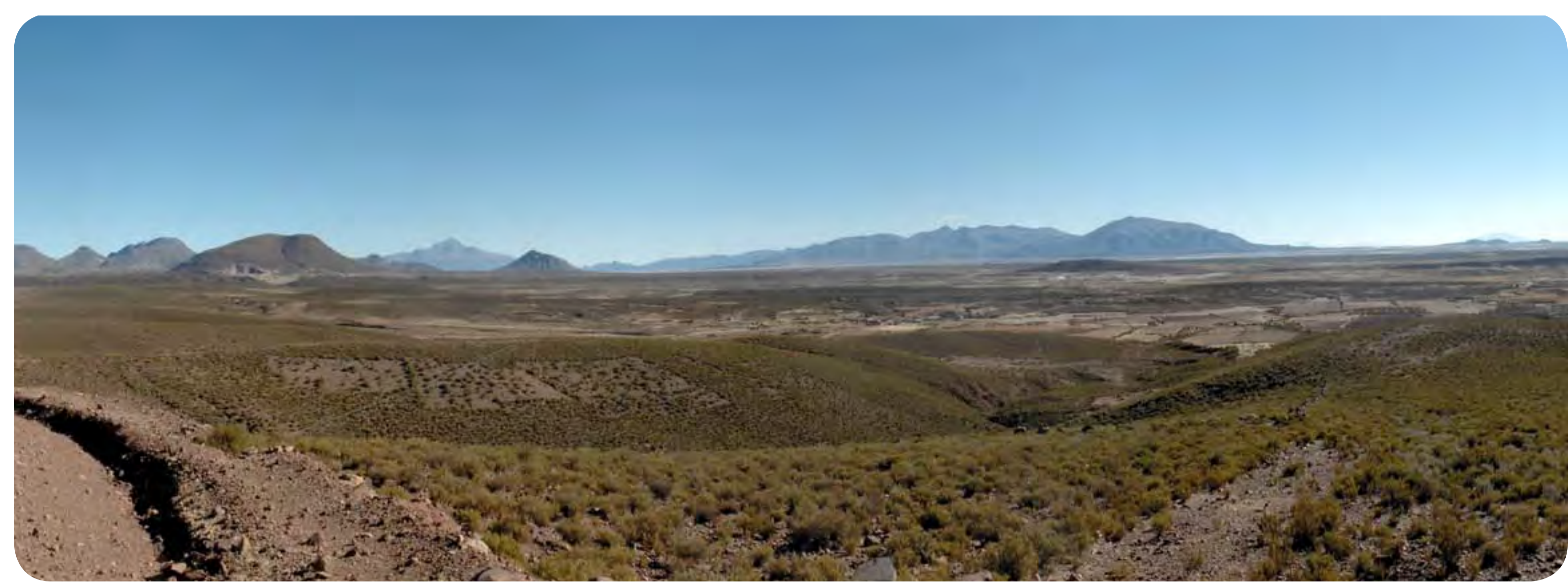
... aux plaines arides du centre