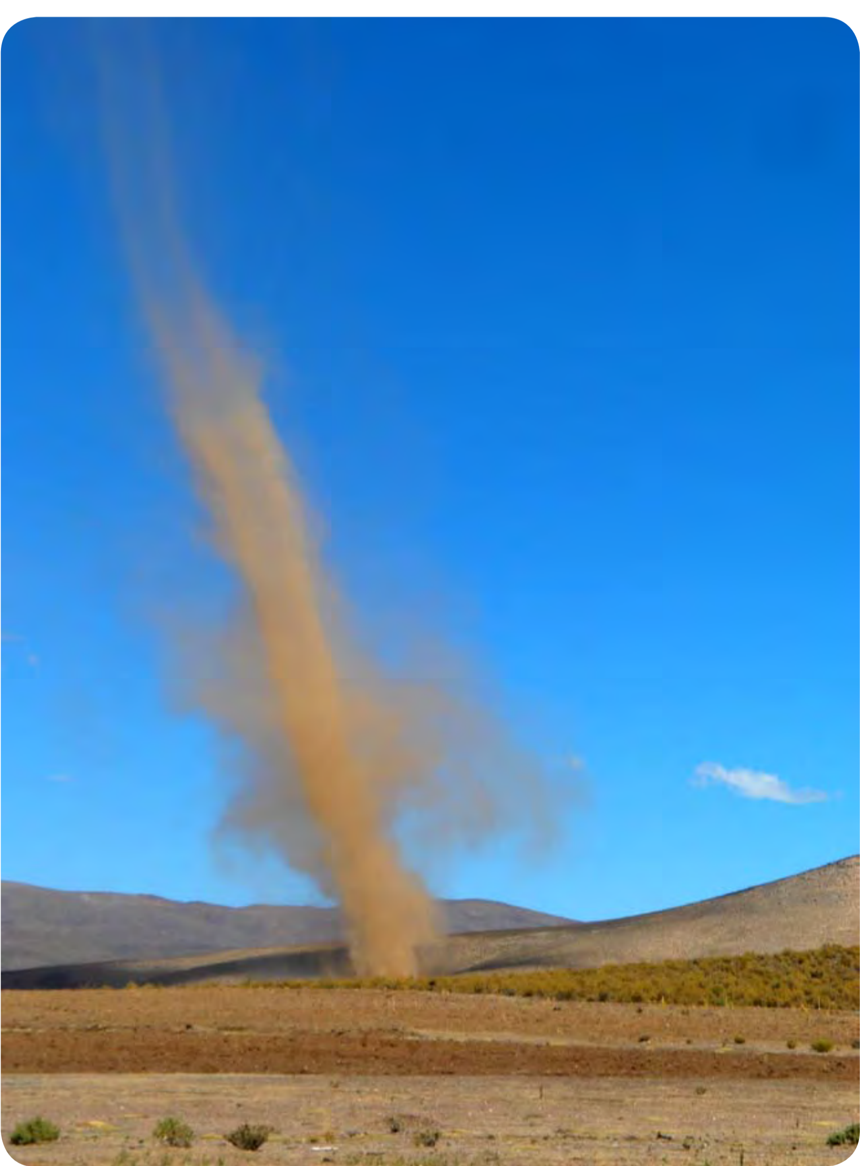
Erosion du sol par le vent

Dans le sud de l'altiplano bolivien, le sol est généralement constitué de 90% de sable avec une très faible teneur en matière organique. Sa fertilité naturelle est donc limitée et sa structure fragile, mais sa capacité de stockage de l'eau est importante.