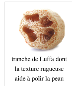
tranche de Luffa dont la texture rugueuse aide à polir la peau