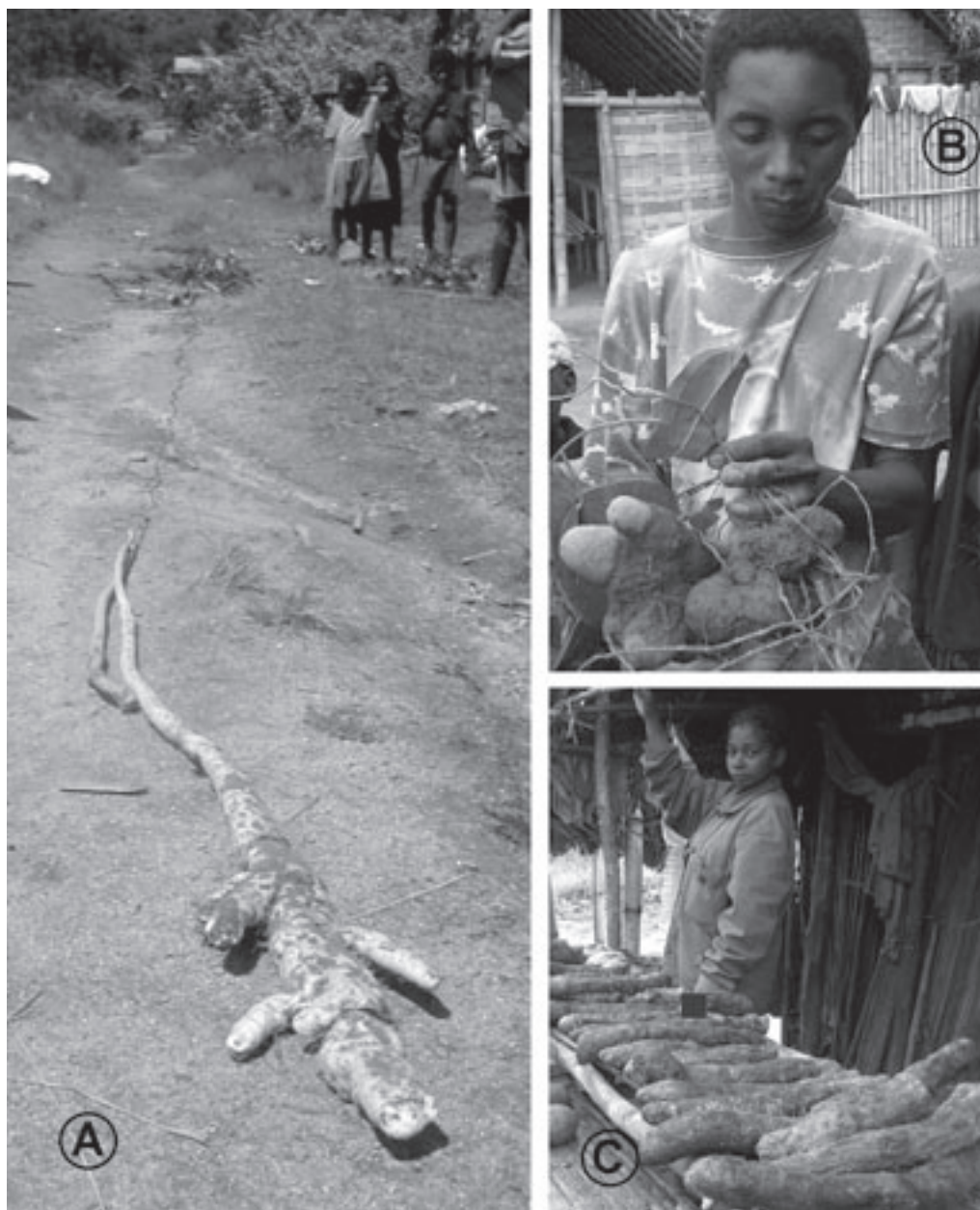
Figure 4. — Exemples d'ignames de la région de Brickaville : une espèce endémique de forêt dense humide, Dioscorea seriflora (A), dont le tubercule, fort apprécié, est devenu rare autour des villages; une espèce introduite, D. cayenensis (B), peu utilisée actuellement; et le cultivar le plus courant de D. alata , ovibe (C), vendu sur le bord de la route (photos A. et C. M. Hladik).

La densité d'une igname entretenue par l'homme ( D. alata , ovibe ) est plus remarquable car elle est présente sur toutes les parcelles analysées et atteint localement 1 720 pieds à l'hectare, ce qui correspond à un rendement annuel de 5 à 6 tonnes de tubercules. Les autres variétés de D. alata sont beaucoup plus dispersées, de même que D. cayenensis ( ovihazo ). Enfin certaines ignames ont été observées exclusivement auprès des habitations : c'est le cas notamment des cultivars de D. alata boganomby et lohamboay ainsi que de l'espèce D. esculenta .