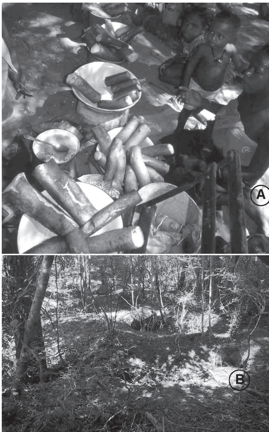
Figure 2. — Utilisation d'une igname endémique de collecte, Dioscorea maciba , dont les tubercules cuits sont vendus sur le bord de la route dans la région de Morondava (A) et aspect des lieux de récolte, avec de nombreuses excavations du sol (B) dans une forêt sèche de l'ouest de Madagascar.