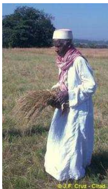
Producteur de fonio en Guinée

Site du Cirad Annuaire des sites du Cirad