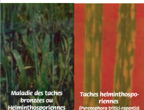
Maladie des taches bronzées ou Helminthosporiennes

L'agent pathogène se conserve sous forme de spores et de mycélium sur les résidus du blé infecté à la surface du sol. Sur les chaumes, les périthèces