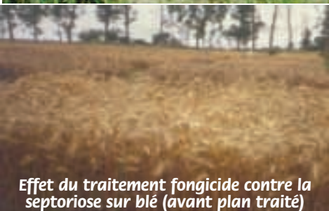
Effet du traitement fongicide contre la septoriose sur blé (avant plan traité)

Les précipitations constituent le facteur de contamination principal. Les spores qui sont produites dans les pycnides des feuilles basses, ne peuvent être transportées sur les feuilles du haut que par l'énergie cinétique fournie par les gouttes de pluie. L'accumulation de 15 mm de précipitation en une ou deux journées consécutives résulte en un développement significatif de la maladie en absence d'intervention fongicide au moment opportun.