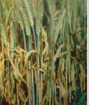
Attaque généralisée de septoriose sur blé dur