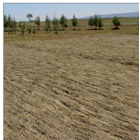
Couverture végétale d'avoine préparée pour le semis