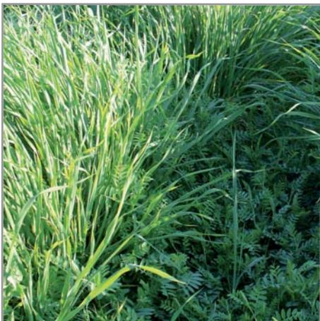
Mélange Avoine + vesce