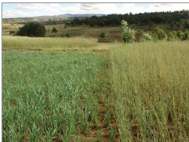
Avoine de saison intermédiaire en végétation et avoine de premier cycle en cours de maturation sur les Hautes Terres

* dès les premières pluies (en octobre - novembre) pour une utilisation en couverture végétale en février-mars, après floraison