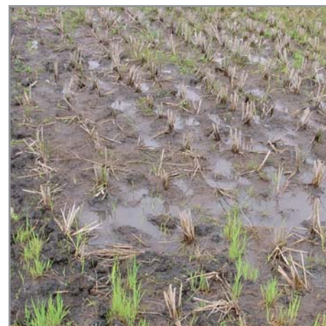
Mort de l'avoine sur sol engorgé

Enfin, l'avoine se développe assez mal sous ombrage, dans les associations trop denses.