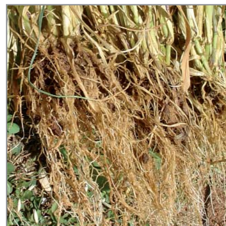
Système racinaire fasciculé de l'avoine

En conséquence, les cultures installées sur résidus d'avoine peuvent généralement être conduites sans utilisation d'herbicide.