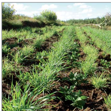
Avoine et pomme de terre

De manière générale, le traitement de semence n'est pas nécessaire pour l'avoine.