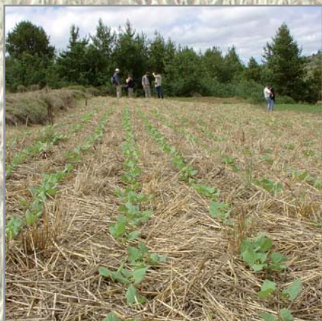
Haricot sur couverture d'avoine