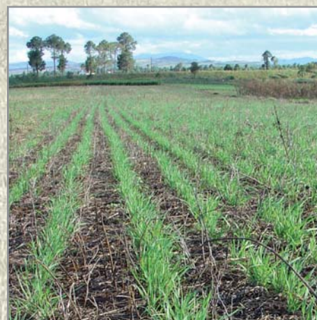
Avoine après haricot