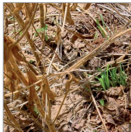
Avoine semée en dérobé dans le soja