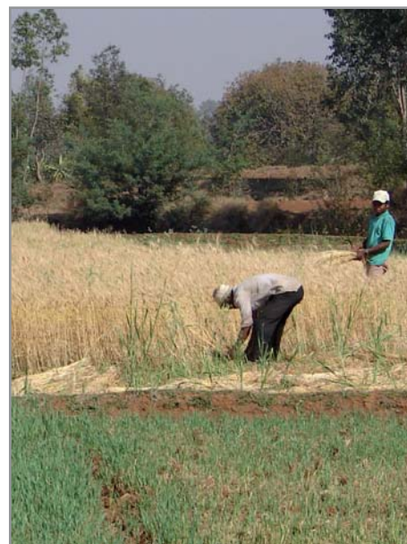
Fauche de l'avoine

Le semis de la culture dans la couverture d'avoine se fait en déplaçant la paille le moins possible. Il suffit d'ouvrir un petit trou pour mettre les graines dans le sol, sans remonter de terre au dessus de la paille. Il faut s'assurer de bien localiser les semences dans le sol et non en surface, dans la couverture, surtout si cette couverture est très importante et que le mulch n'est pas encore tassé. Ce semis peut se faire simplement avec une petite angady ou un bâton, ou encore avec une canne planteuse, une roue semeuse ou un semoir mécanisé (qui ouvre alors un petit sillon dans la couverture végétale).