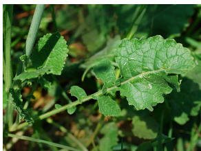
Feuille inférieure lyrée typique de Sinapis arvensis