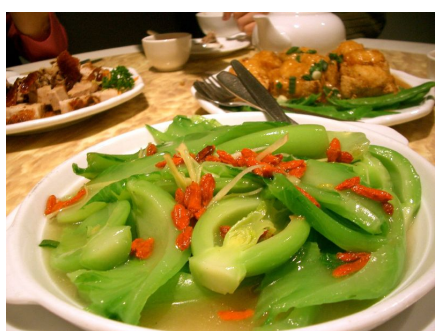
Plat cantonais à base de branche de moutarde brune et goji