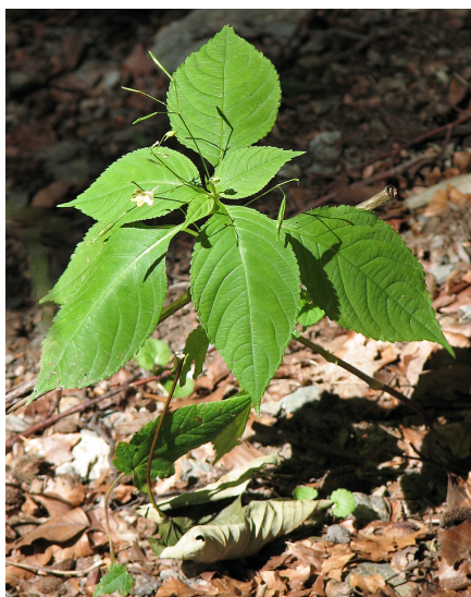
Balsamine des bois