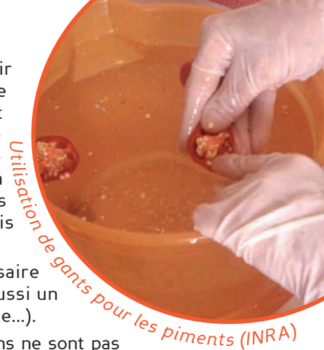
Utilisation de gants pour les piments (INRA)

Les semences ainsi obtenues conservent leur pouvoir germinatif entre 4 et 10 ans en fonction de la variété et des conditions de stockage. Selon les variétés et les conditions de culture, il y a environ 320 à 550 graines par gramme (450 à 700 gr/g chez les tomates cerise). Le taux de germination réglementaire minimum est de 75%.