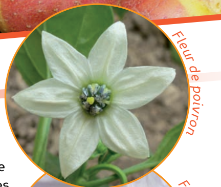
Fleur de poivron

Les fleurs de tomates, regroupées en bouquet, sont relativement petites et n'attirent que peu l'attention des insectes. Cette espèce est majoritairement autogame. Pour l'aubergine et le poivron, les fleurs sont plus grosses et plus accueillantes pour les insectes, ce qui augmente grandement les risques d'hybridation. Pour ces deux dernières espèces, il est préférable de considérer les plantes comme autogames à tendance importante vers l'allogamie.