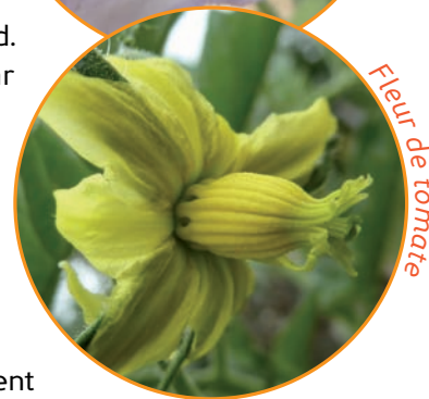
Fleur de tomate