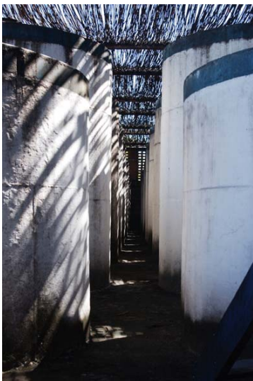
Tonneaux en béton