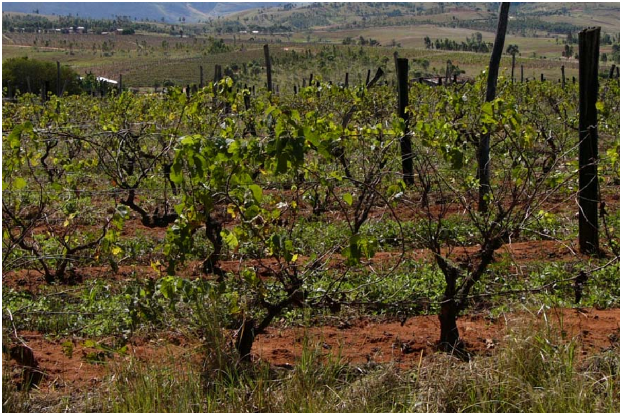
Selon la confirmation d'un spécialiste en matière de vin européen, viticulture – mal entretenue – à Ambalavao

▶ A voir aussi dans les chapitres suivants : Agriculture , Aide au développement , Cartes touristiques –Hauts plateaux, Données du pays en bref , Eau potable , Économie – symbole sur la carte, Fiches d'informations des grandes localités – Ambalavao , Fianarantsoa (photo domaine viticole), Fruits , Géographie –Hauts plateaux, Glossaire –Sahambano, Itinéraires de voyage – tous les itinéraires du sud, Localités – Ambalavao , Petites et moyennes entreprises , Produits alimentaires , Repas pour les touristes , Travaux , Villes – Fianarantsoa .