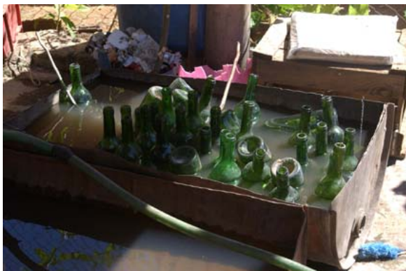
Lieux de nettoyage et...