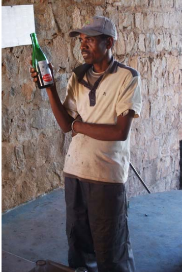
Dégustation du vins à la ...