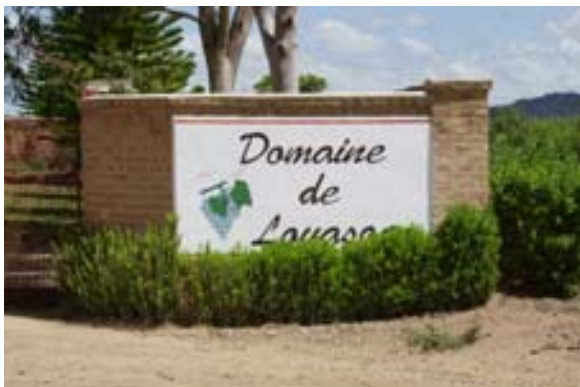
Vignoble au domaine de Lovaso à la RN 7