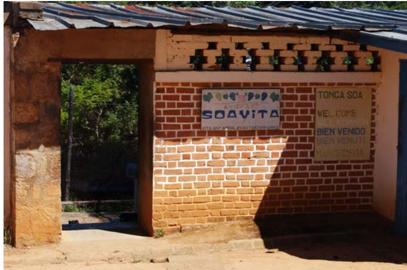
...cave SOAVITA à Ambalavao