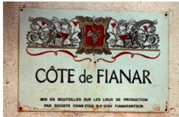
Panneau publicitaire d'un vignoble