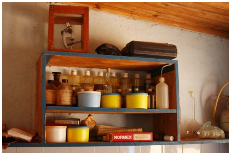
Laboratoire, dont le contenu permet de se fermer