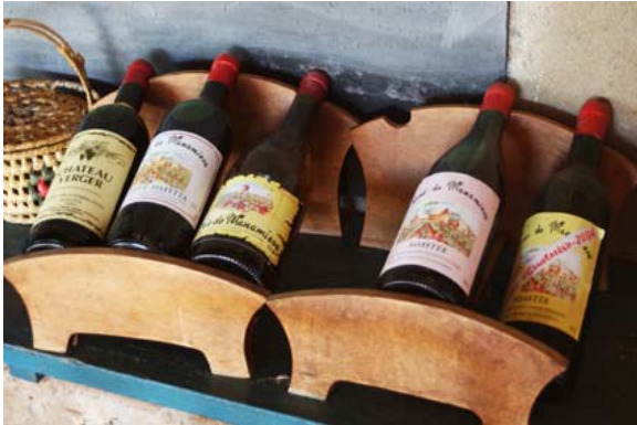
Sortes de vins dans la cave de SOAVITA d' Ambalavao