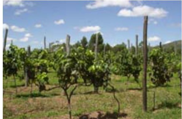
Vignobles de Lovasoa