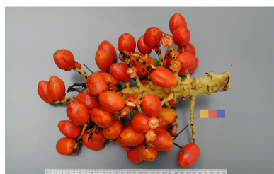
fruits du Bactris gasipaes

Les paréou sont toujours consommés cuits ou grillés en Guyane et au Costa Rica, et on en tire aussi une bière traditionnelle, le masato.