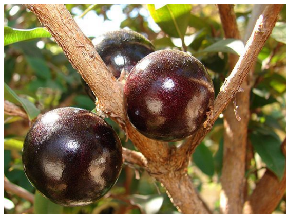
Frutos de jabuticaba.

Es una planta nativa de la Mata Atlántica, en Brasil, pero se encuentra también en Paraguay donde se lo conoce por el nombre guaraní de Yva Puru o Yva Hu . Yvapuru: yva fruta, purũ palabra onomatopéyica que reproduce el sonido de la fruta al morderla: pururũ . También hay ejemplares nativos en la provincia argentina de Corrientes y Misiones, en Bolivia, donde su distribución natural corresponde al departamento de Santa Cruz, en áreas secas o subhúmedas abajo de los 1.700 m de altitud. Dentro de