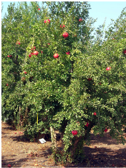
Grenadiers cultivés en Galilée en Israël

L'espèce tolère la sécheresse et peut supporter de courtes périodes de gel (jusqu'à -15 °C) mais il préfère les climats secs. En zone humide, le grenadier a du mal à fructifier, car il a besoin de fortes chaleurs pendant toute la période de fructification, sinon il est attaqué par des maladies fongiques dont il ne se remet pas.