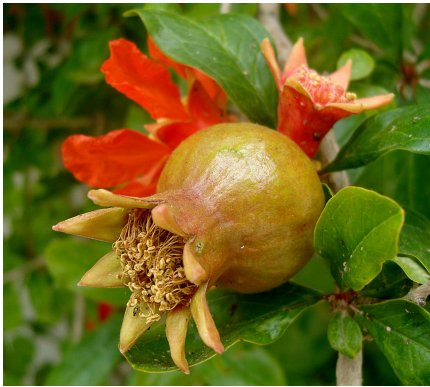
Feuilles fleurs et fruit

C'est une espèce originaire d'Asie occidentale (Turquie, Iran, Irak, Azerbaïdjan, Afghanistan, Pakistan, Arménie), et probablement la péninsule Arabique, ainsi que le nord de l'Afrique.