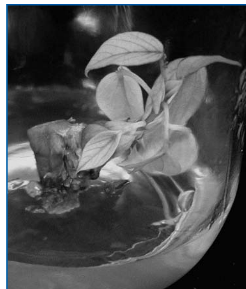
Figura N.º 3. Desarrollo de la yema in vitro a partir de tejido madre.