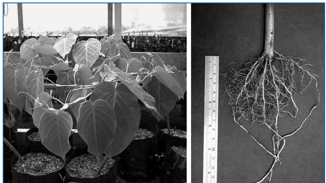
Figura N.º 1. Brotación y desarrollo radical de las estacas en invernadero.

El material de La Pastora de San Marcos de Tarrazú no presentó problemas fitosanitarios y se logró un promedio de un 63% de estacas enraizadas y brotadas sanas, después de un mes y medio de introducidas en el invernadero (Figura. N.º 1).