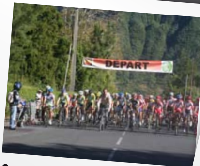
Grand prix cycliste, le 3 mai