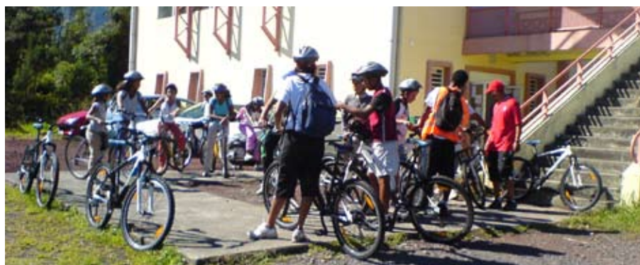
Sports Vacances Loisirs va encore être un succès

Alors si votre bambin n'est pas sage, prévenez-le : pas de Sports Vacances Loisirs ! Essayez, ça fonctionne.