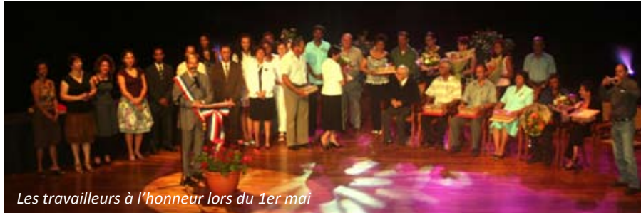
Les travailleurs à l'honneur lors du 1er mai

Le Maire, le Conseil Municipal, les collègues et les familles avaient rendez-vous le vendredi 1er mai dernier pour honorer et manifester leur respect et affection aux récipiendaires de la Fête du Travail.