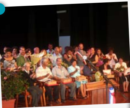
Cérémonie de la Fête du Travail, 1er mai