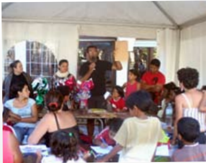
La course aux oeufs, 12 avril