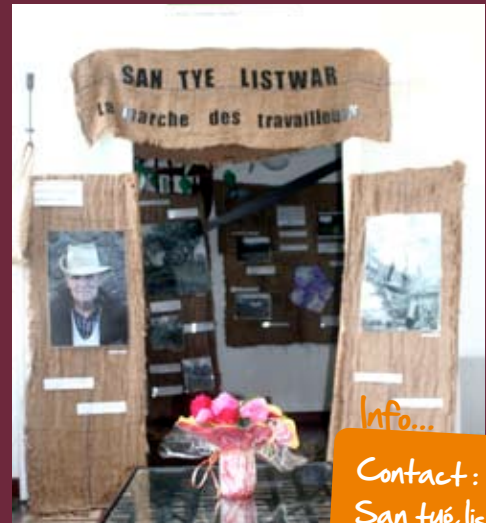
L'exposition « San tyé listwar » aux Tourelles