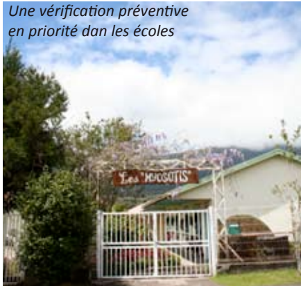
Une vérification préventive en priorité dans les écoles

A ce jour, la recherche n'avait pas encore été faite sur la Commune de La Plaine des Palmistes. La Municipalité a donc procédé à une consultation afin de choisir le prestataire le plus apte pour ce travail de recherche. L'entreprise ARCHI-TEX a été retenue fin de réaliser ce diagnostic de présence éventuelle d'amiante dans les locaux des établissements scolaires Les Myosotis et Claire Hénou ainsi que de la