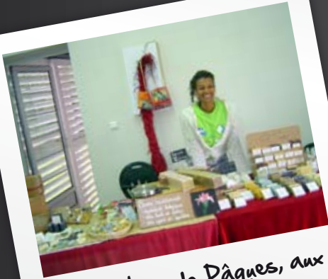
Les ateliers de Pâques, aux Tourelles, 5 au 13 avril