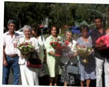
Cérémonie de la Famille Française, 6 juin