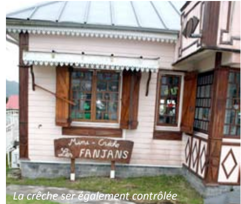
La crèche ser également contrôlée

A ce jour, la recherche n'avait pas encore été faite sur la Commune de La Plaine des Palmistes. La Municipalité a donc procédé à une consultation afin de choisir le prestataire le plus apte pour ce travail de recherche. L'entreprise ARCHI-TEX a été retenue fin de réaliser ce diagnostic de présence éventuelle d'amiante dans les locaux des établissements scolaires Les Myosotis et Claire Hénou ainsi que de la