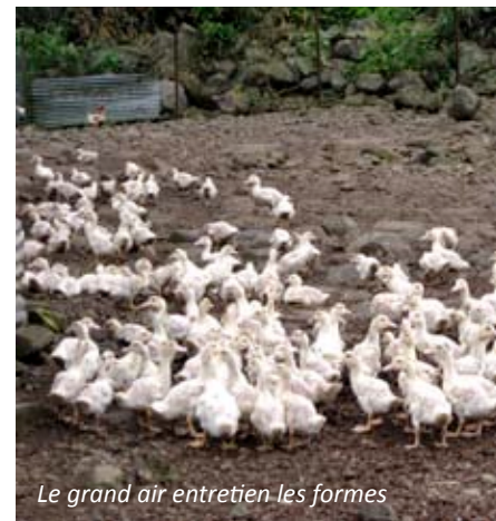
Le grand air entretient les formes