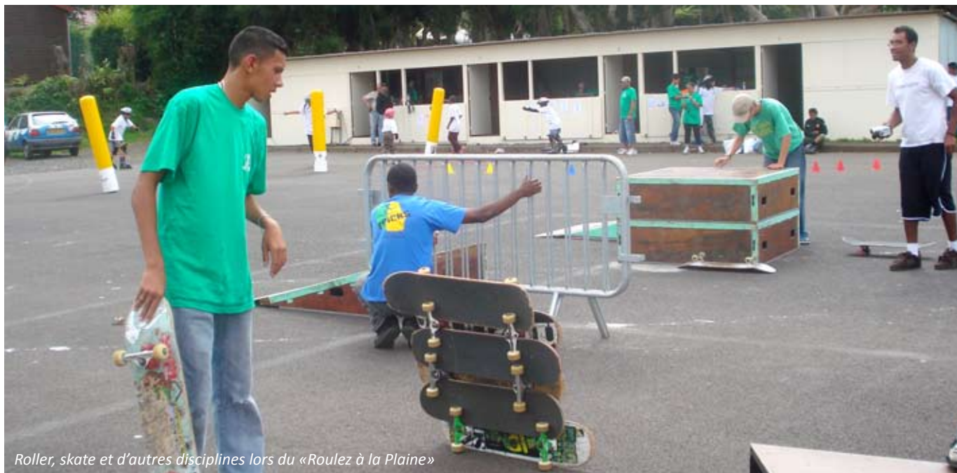
Roller, skate et d'autres disciplines lors du «Roulez à la Plaine»

de sécurité pour une première séance gratuite. Par la suite, le paiement de la cotisation annuelle comprenant la licence, vous ouvre toutes les voies pour devenir les rois de la glisse. Des sorties « roller » sont régulièrement programmées sur les jolies routes de la Plaine d'abord pour une première mise en confiance, puis sur des sites extérieurs, sur le littoral. Les plus téméraires participent aux compétitions de hockey. Il y a encore quelques années, l'équipe des cadets du JRP a été sacrée