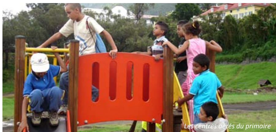
Les centres aérés du primaire