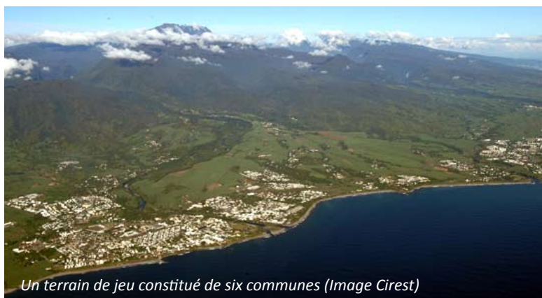
Un terrain de jeu constitué de six communes