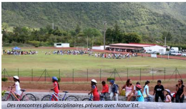
Des rencontres pluridisciplinaires prévues avec Natur'Est

Alors, si vous craignez de commencer les vacances dans le froid de l'hiver austral, soyez rassurés. Préparez plutôt vos baskets et courez dès maintenant vous renseigner à l'OMS.