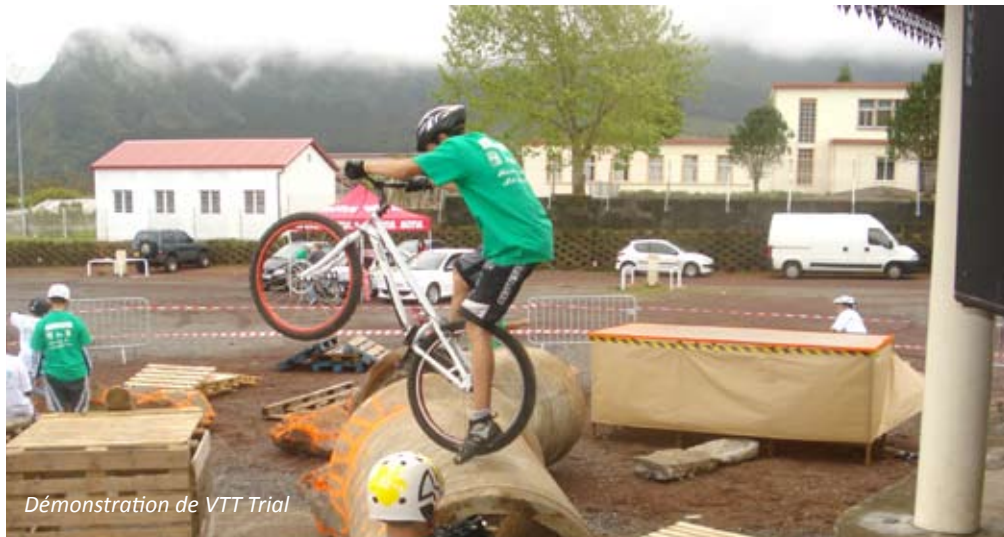
Démonstration de VTT Trial