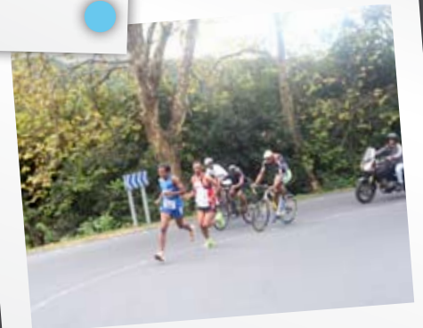
Course de côte du CAPP, 6 juin