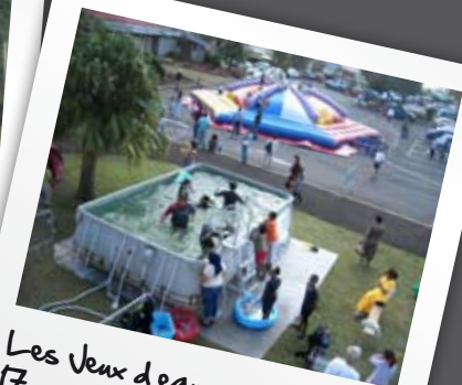
Les Jeux d'eau, 17 mai