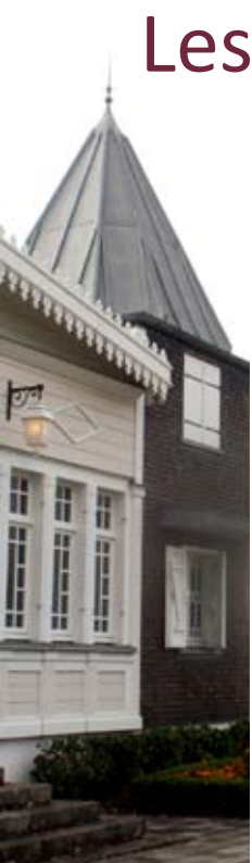
Le domaine des Tourelles, à visiter lors des Journées du Patrimoine

Rendez-vous les 19 et 20 septembre 2009 pour la 26 e édition des Journées du patrimoine qui auront pour thème « Un patrimoine accessible à tous »