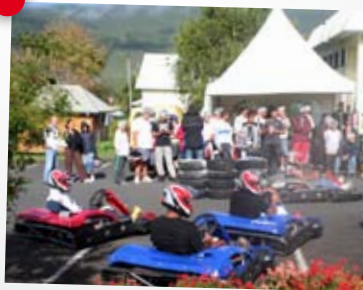
Week end sports mécaniques, 22, 23 et 24 mai