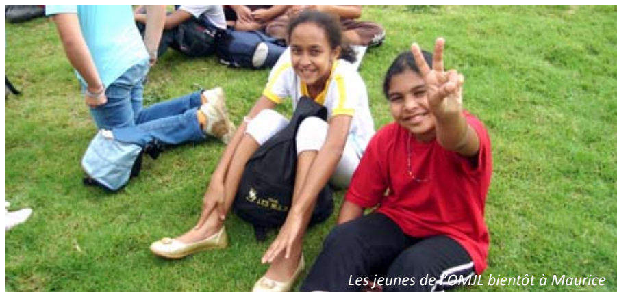
Les jeunes de l'OMJL bientôt à Maurice

Le budget prévisionnel de l'action envisage une implication financière à hauteur de 27 % pour les parents, 16 % pour la Municipalité, 16 % pour la C.A.F., 4 % pour l'OMJL et 37 % pour les actions de vente. Nul doute que l'énergie des jeunes, des parents et de l'OMJL trouvera un écho favorable pour la réalisation de ce projet.