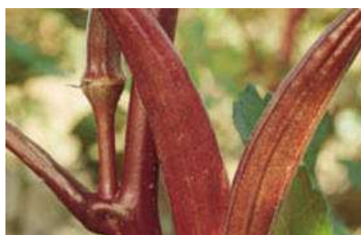
Abelmoschus esculentus 'Red Velvet'