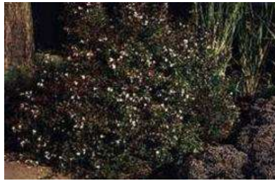
Abelia dielsii 'Sherwoodii'