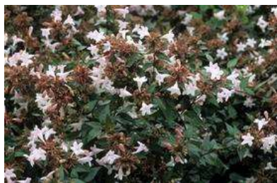
Abelia x grandiflora