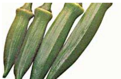
Abelmoschus esculentus 'Baby Bubba'