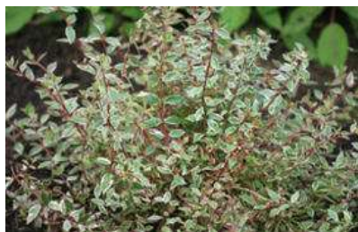
Abelia x grandiflora 'Silver anniversary'