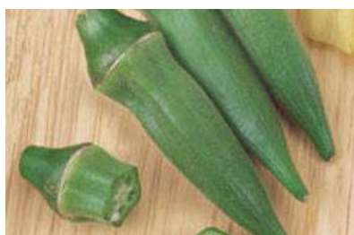
Abelmoschus esculentus 'North & South'