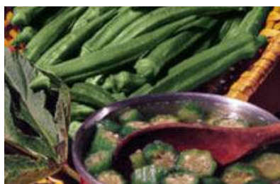
Abelmoschus esculentus 'Clemson Spineless'