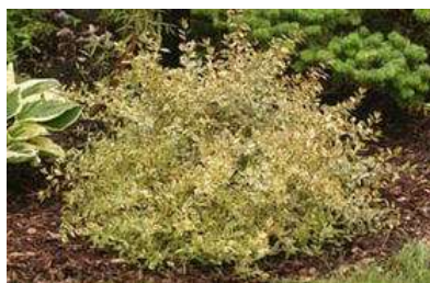
Abelia x grandiflora 'Golden anniversary'