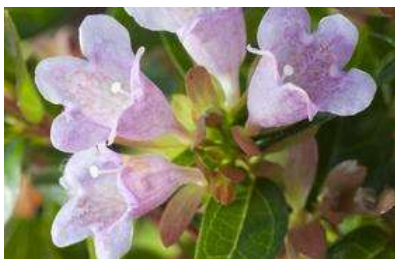
Abelia x 'Edward Goucher'