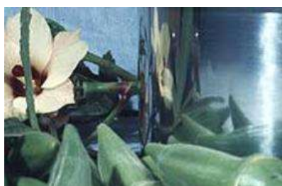
Abelmoschus esculentus 'Long Green Pod'