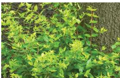
Abelia x grandiflora 'Bronze anniversary'