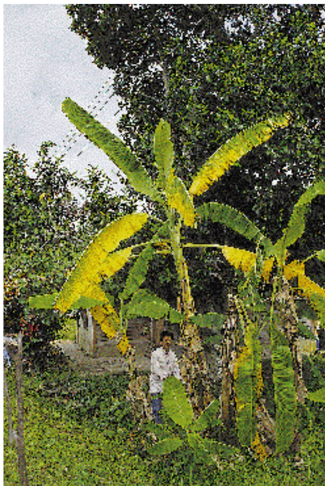
Pisang Awak (ABB) présentant les symptômes foliaires de la fusariose.

n'ait été signalée à ce jour sur les Cavendish cultivés dans la région d'Amérique latine et des Caraïbes, le commerce mondial des bananes se trouve de nouveau menacé par la fusariose.