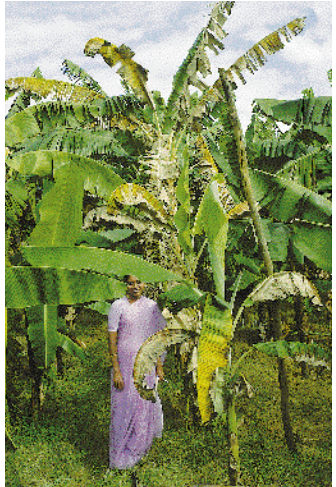
Silk (AAB), un cultivar très prisé dans nombre de pays asiatiques, est extrêmement sensible à la fusariose.

Quatre races de Foc sont actuellement connues. Le terme de 'race' est utilisé de façon relativement informelle pour ce pathosystème, puisque les bases génétiques de la sensibilité et de la résistance n'ont pas encore été caractérisées. Les races actuellement identifiées de Foc correspondent à des souches de l'agent pathogène dont il a été observé qu'elles sont pathogènes en champ vis-à-vis de cultivars hôtes particuliers. La race 1 est pathogène pour les cultivars des sous-groupes AAB 'Silk' et 'Pome' et pour AAA 'Gros Michel'. La race 2 est pathogène pour ABB 'Bluggoe' et pour d'autres bananes à cuire étroitement apparentées. La race 3 a été observée au Honduras, au Costa Rica et en Australie, sur des espèces d' Heliconia , et n'a guère d'effet sur le bananier. La race 4 s'attaque au sous-groupe AAA 'Cavendish' et à tous les cultivars attaqués par les races 1 et 2. La série actuelle d'hôtes différentiels ne permet pas d'évaluer adéquatement la virulence des populations des races identifiées à ce jour. En raison des interactions entre plante et environnement, il n'est pas toujours possible de caractériser les