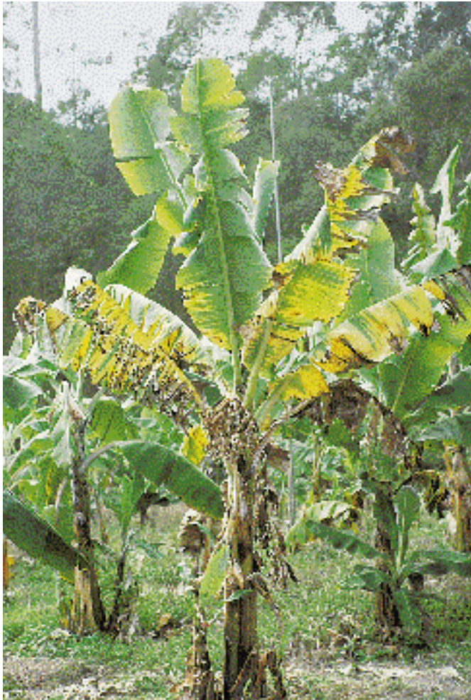
Les isolats de Foc présents en Australie, Indonésie, Malaisie, Philippines, Taiwan, Afrique du Sud et Iles Canaries peuvent attaquer les clones de bananiers Cavendish (AAA).

centrale dans les années 30. Des sols de ce type ont été également signalés aux îles Canaries, en Australie et en Afrique du Sud.