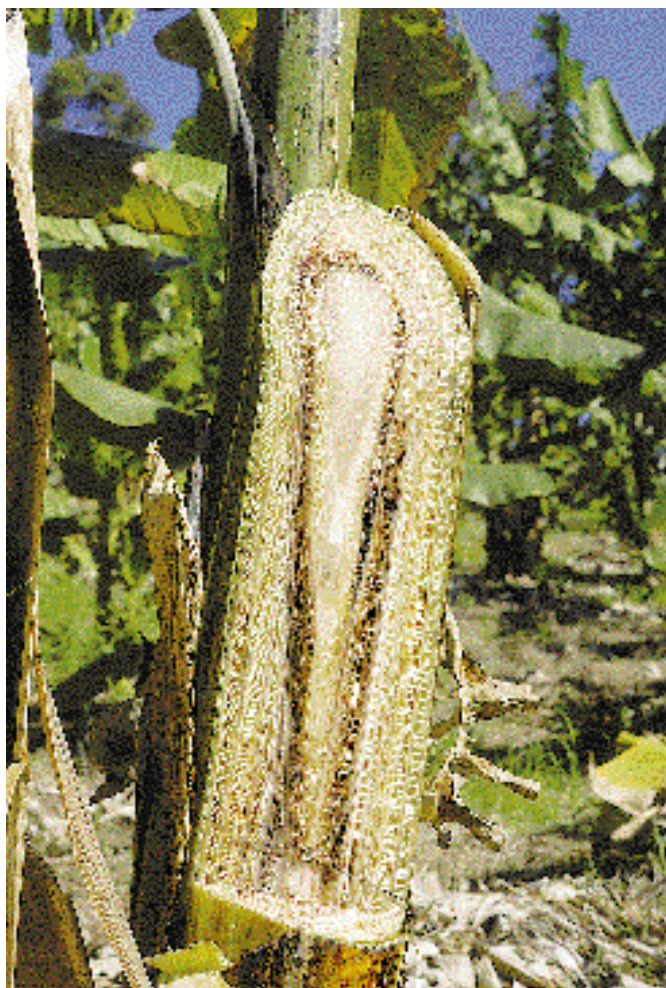
Section d'un pseudo-tronc montrant la décoloration du tissu vasculaire provoquée par Foc.