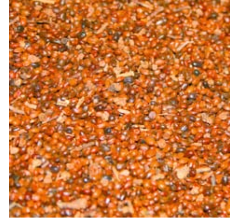
L'huile de graine d'argousier est extraite à froid.

C'est à l'aide de dioxyde de carbone supercritique 1 que Yuhangren extrait la précieuse huile des graines enfouies dans les baies d'argousier. D'une belle couleur dorée, elle