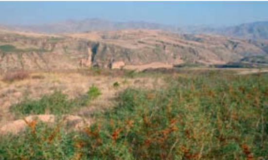
Une région montagneuse et aride.

variétés chinoises, russes et mongoles. Cet argousier est capable de pousser sur des sols particulièrement pauvres et sablonneux. De cette façon, il est utile pour stabiliser le sol et le protéger contre l'érosion par les vents.» C'est donc une plante idéale contre