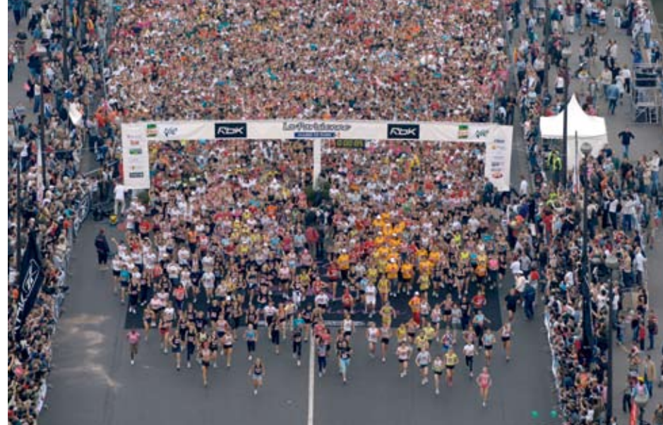
Plus de 10000 femmes ont participé cette année à la Parisienne.

participerons à « La Parisienne », une course à pied de 6 km qui attire depuis 10 ans plus de 10000 femmes. Cette course de grande envergure est placée, cette année, pour célébrer le jumelage avec la ville de Casablanca, sous l'égide de la rose du Maroc. Après une reconnaissance attentive du parcours, nous regagnons nos chambres pour être au maximum de notre forme dès le lendemain.