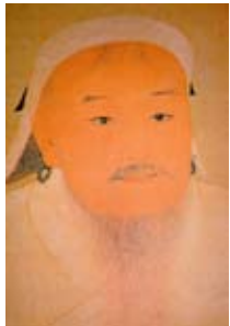
Gengis Kan (1162–1227), fondateur de l'empire mongol.

la désertification, qui représente un véritable fléau en Mongolie intérieure. C'est pourquoi Yuhangren a également initialisé un projet de culture d'Argousier à la limite occidentale du grand désert de Gobi, dans le Nord de la Chine, et vient d'achever un projet d'amélioration de