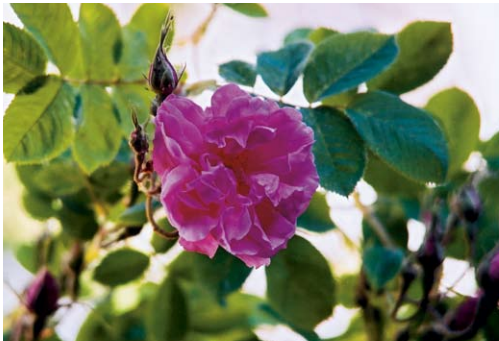
Weleda a implanté la culture biologique de roses à parfum au Maroc.