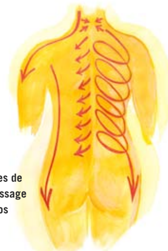
Lignes de pétrissage du dos

Une personne souffrant d'insomnie est souvent mal réveillée pendant la journée, pas assez forte dans sa volonté, pas assez incarnée pour trouver la force d'agir. Dans ce cas, un massage rythmique du dos s'avère très bénéfique. Il réveille la chaleur et la conscience dans cette zone du corps, permettant à la personne de mieux s'incarner. On insiste sur les régions de grande densité osseuse : le bassin, le sacrum, les hanches et les trochanters (gros os situés au bas de chaque hanche). Des pétrissages effectués avec calme depuis la profondeur des tissus appellent la chaleur. Des mouvements tourbillonnaires avec leurs accents rythmés stimulent les tissus, souvent « sourds » en ce lieu.