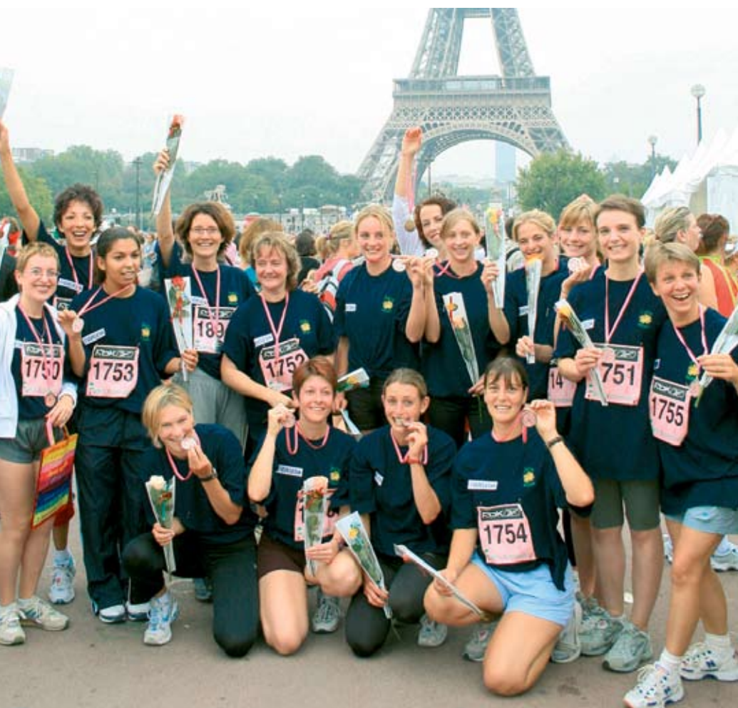
L'équipe Weleda au complet, après le passage de la ligne d'arrivée.

A l'arrivée, une rose et un thé à la menthe nous sont offerts pour récompenser nos efforts. Après une suite d'étirements, nous nous massons, cette fois pour faciliter la