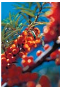
Les baies orange vif de l'argousier ( Hippophae rhamnoides ) gorgées de vitamines, source de vitalité pour l'organisme.

Imprimé sur papier écologique recyclé, blanchi sans chlore.