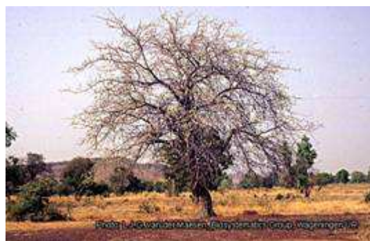
Port de l'arbre Sclerocarya birrea à la saison sèche.