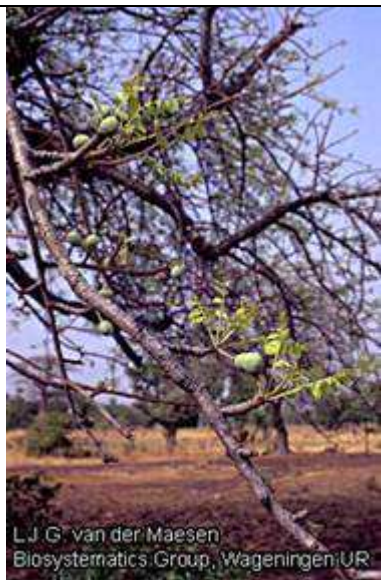
Branche avec feuilles et fruits.