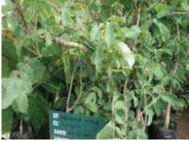
Jeunes plantes de pruniers d'Afrique.