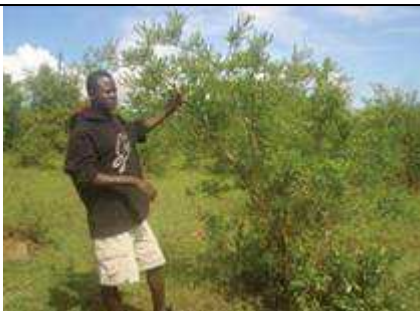
Regeneration naturelle du prunier d'Afrique à Migori (Sud du Kenya).