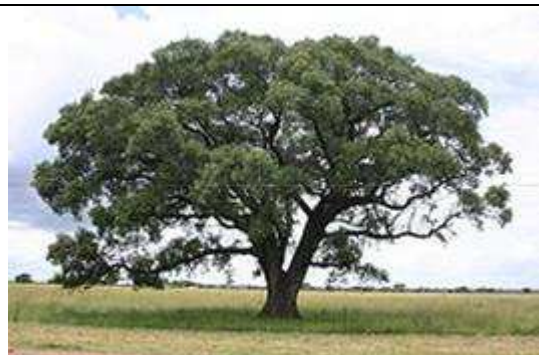
Arbre Sclerocarya birrea .