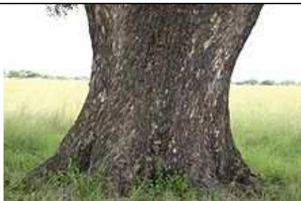
Tronc de Marula .