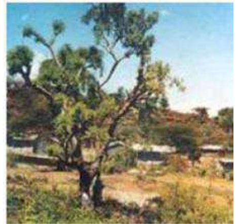
Branches de prunier d'Afrique coupées pour obtenir du fourrage dans le district de Baringo (Kenya). Photo © B. MUOK.

Photo © B. MUOK. Source : Sclerocarya birrea - Prunier d'Afrique, SAFORGEN (voir partie " bibliographie ", dans ce document).