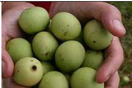
Fruits de Marula .