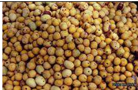
Fruits récoltés. Source : Prota database.

Source : Sclerocarya birrea - Prunier d'Afrique, SAFORGEN (voir partie " bibliographie ", dans ce document).