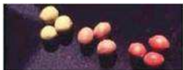
Différences de couleur des fruits.

Source : Sclerocarya birrea - Prunier d'Afrique , SAFORGEN (voir partie " bibliographie ", dans ce document).