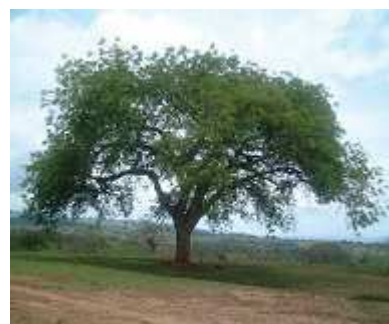
Prunier d'Afrique dans un parc agroforestier. Photo © B. MUOK. Source : Sclerocarya birrea - Prunier d'Afrique , SAFORGEN (voir partie " bibliographie ", dans ce document).