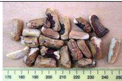
Graines de Marula . Source : Wikipedia Fr.