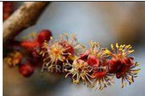
Fleurs du prunier d'Afrique.