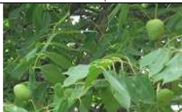
Fruits et feuilles.