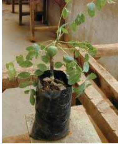
Greffes de jeunes pruniers d'Afrique.

Source : Sclerocarya birrea - Prunier d'Afrique, SAFORGEN (voir partie " bibliographie ", dans ce document).