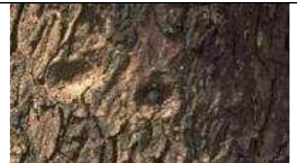
Ecorce de S. birrea (photo © Roeland Kindt).

Fleurs de marula , Sabi Sand Game Reserve, Mpumalanga, South Africa, www.afripics.com/home/products/product.php?ProductID=38902