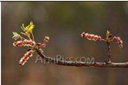
Fleurs du prunier d'Afrique.