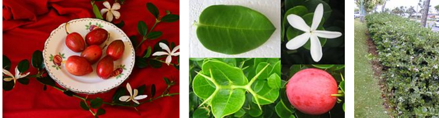
Carissa macrocarpa d'Afrique du Sud ( num num )