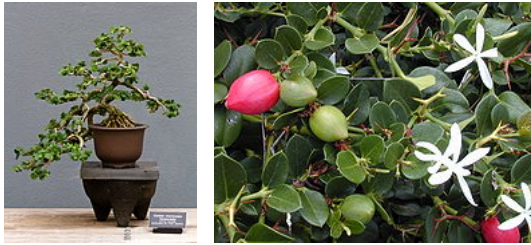
Bonsaï Carissa macrocarpa var. Horizontalis 1