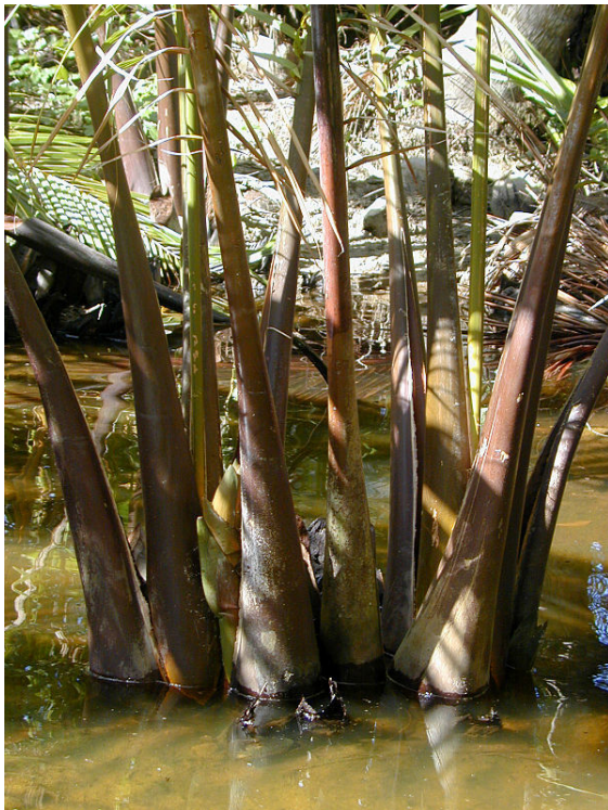
Le stipe du palmier nypa est sous l'eau. Seules les feuilles sont à la surface