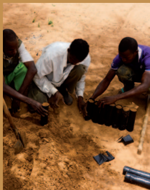
Remplissage des gaines