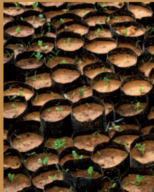
Mise en pépinière