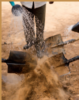
Préparation de la terre

L'implication des populations, notamment des femmes, est essentielle puisque ce sont elles qui assurent l'entretien des pépinières, la préparation des gaines dans lesquelles les graines sont semées et l'arrosage. Les pousses sont conservées trois mois en pépinière. La plantation intervient à la saison des pluies en pleine terre dans des parcelles définies au préalable en concertation