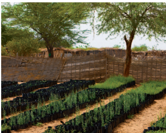
Plants de Dattier du désert

Au cours des huit années suivantes, les parcelles sont clôturées et surveillées. En raison de la fragilité des jeunes arbres, il est interdit d'y faire paître les troupeaux. Mais une fois les arbres bien implantés, les clôtures sont levées avec un accès contrôlé pour les troupeaux.