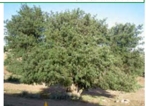
↑ Ports d'arbres ↓

Le porte-greffe qui a été étêté aura tendance à développer des bourgeons à sa base. Ces derniers devront être supprimés pour favoriser le greffon. Les greffages tardifs (juin) seront plus soumis au problème de dessiccation et les plants devront donc être sous une serre ombragée (filet de 70%). Alternativement, le plastique de la serre pourra être tout simplement badigeonné à la chaux.