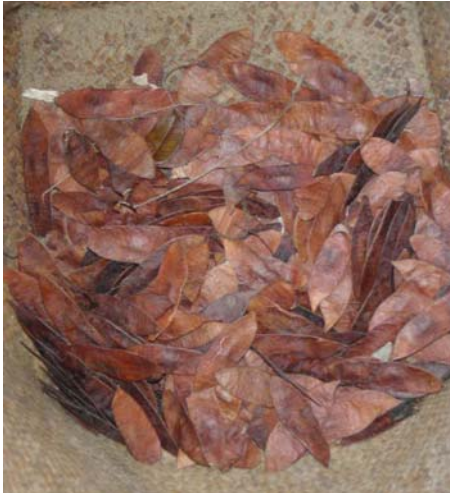
Graines de bois de rose dans leurs gousses

Cette année nous avons pour objectif de replanter 10% de la surface de reboisement 2011 en bois de rose.