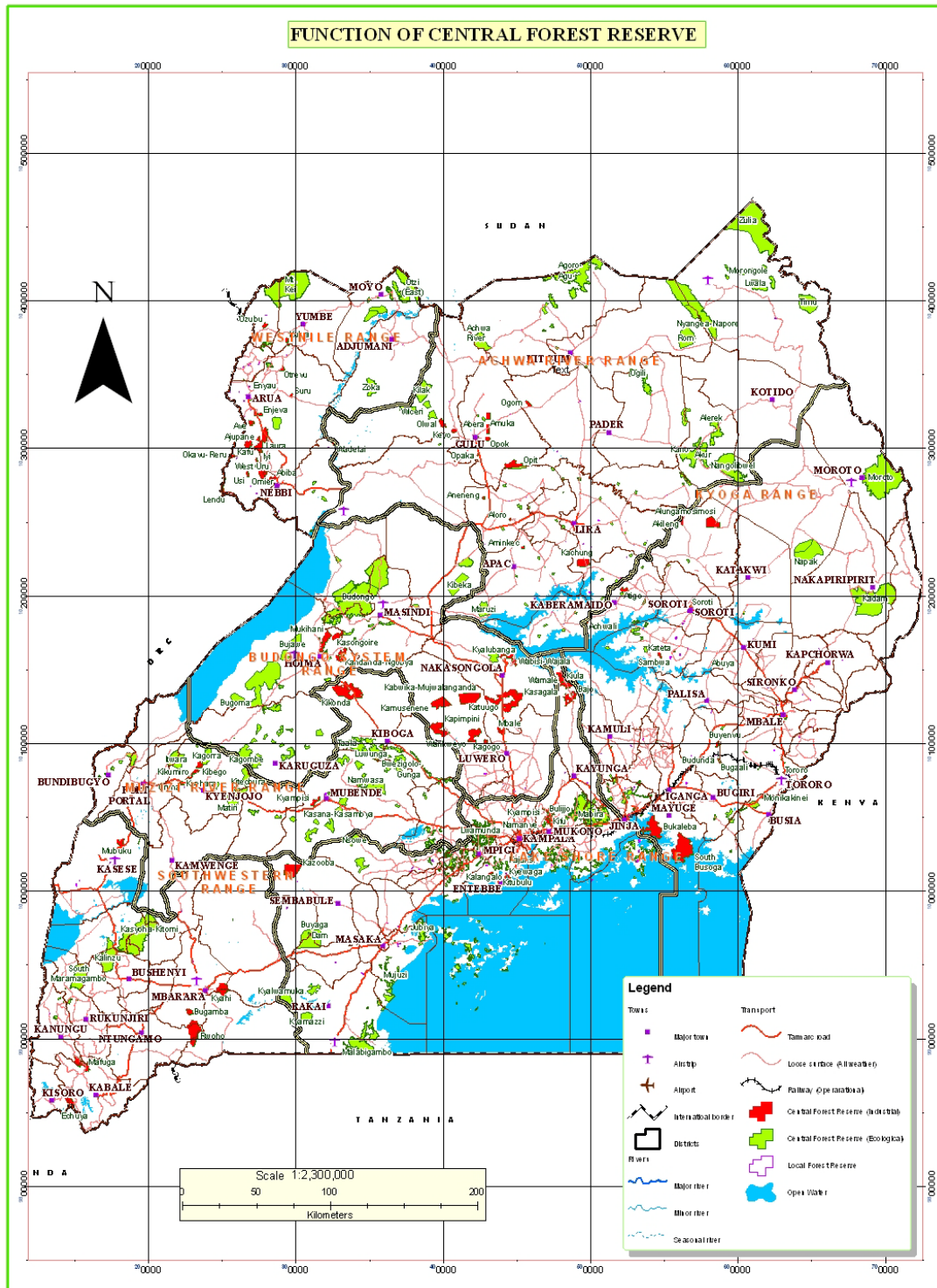
Figure 2. Répartition des plantations forestières dans les Réserves Forestières Centrales.