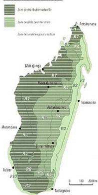
Zones de croissance à Madagascar (B. Cook).