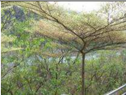
T. mantaly de la variété panachée (tricolore).