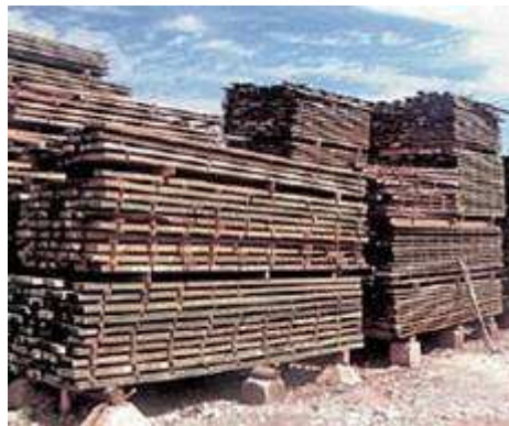
Planches de T. mantaly (B. Cook).