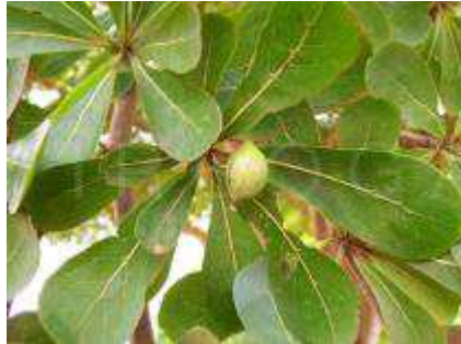
Fruit; Université de Valley View, Oyibi, le Ghana; 7/2005