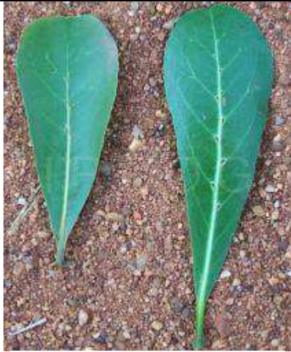
Face supérieure et inférieure de la feuille (à noter les domaties sur la face inférieure); Université de Valley View, Oyibi, Ghana; 7/2005