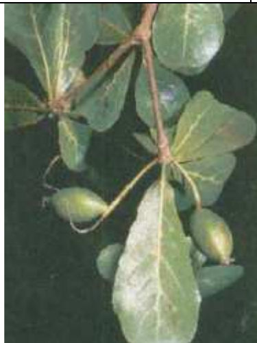
Feuilles et fruits ( www.mampuya.org )