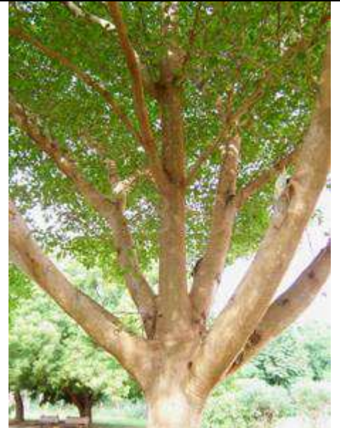
Direction d'insertion des branches; Université de Valley View, Oyibi, le Ghana; 7/2005