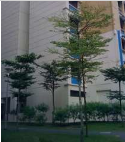
T. mantaly à Singapour.