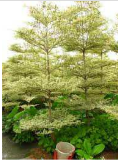
Jeunes plants en pépinières. Source :