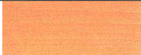
Bois de T. mantaly (B. Cook).