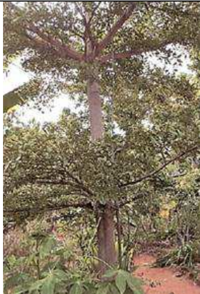
Atlas des bois de Madagascar, Georges Rakotovoao.