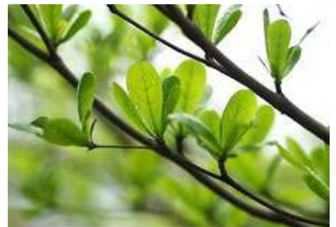
Feuilles de T. mantaly.