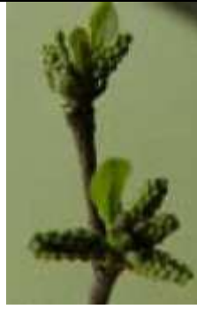
Les bourgeons avec les feuilles naissantes et les fleurs.