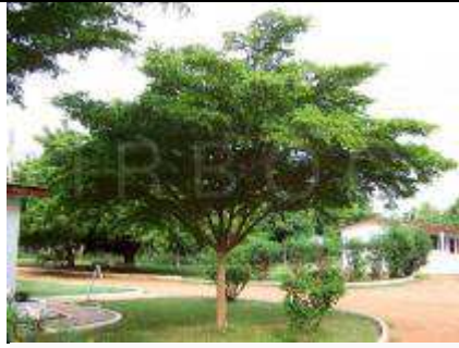
Université de Valley View, Oyibi, le Ghana; 7/2005