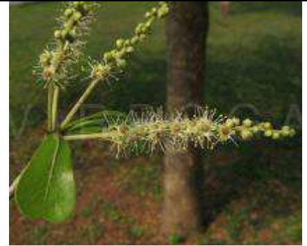
Inflorescence; Valley View University, Oyibi, Ghana; 11/2008