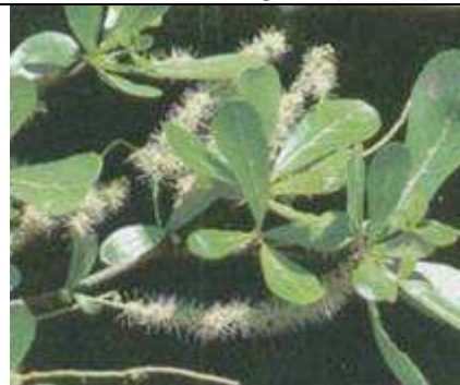
Feuilles ( Centre Mampuya , www.mampuya.org )