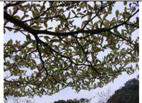
T. mantaly de la variété panachée (tricolore).