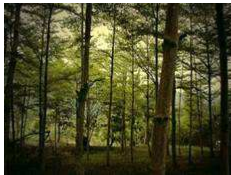
Forêt de T. mantaly à Singapour.