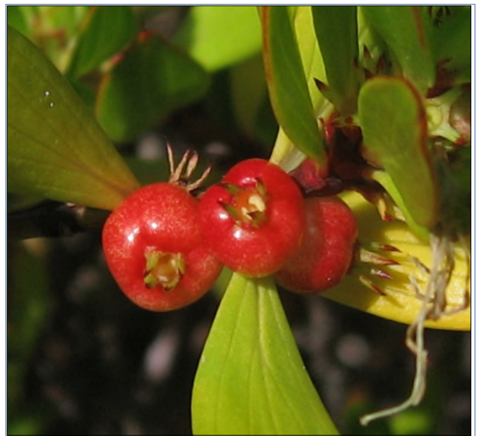
Fig. 20 - Ernodea littoralis

- Guaiacum officinale L. ( Zygophyllaceae ) (Fig. 21 et 22) : Fleurs bleues, nous voyons les fruits, jaune orangé. Le bois très dense était utilisé pour les poulies des navires. L'écorce se desquame par plaques. Le gâiâc donne la teinture rouge utilisée en mycologie. Le gâiâc possède des vertus médicinales (traitement de la syphilis, de l'arthrite, il est inscrit à la pharmacopée française depuis 1884).