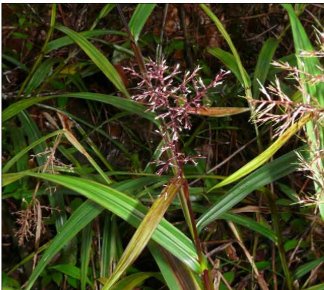
Fig. 84 - Scleria latifolia (terrestre)