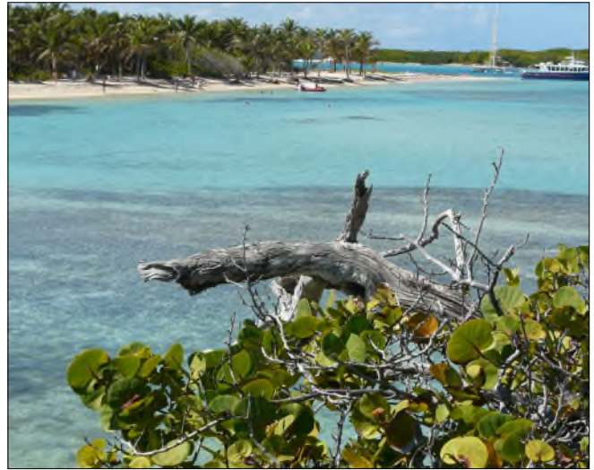
Fig. 16 - La plage à Cocos nucifera et Coccoloba uvifera