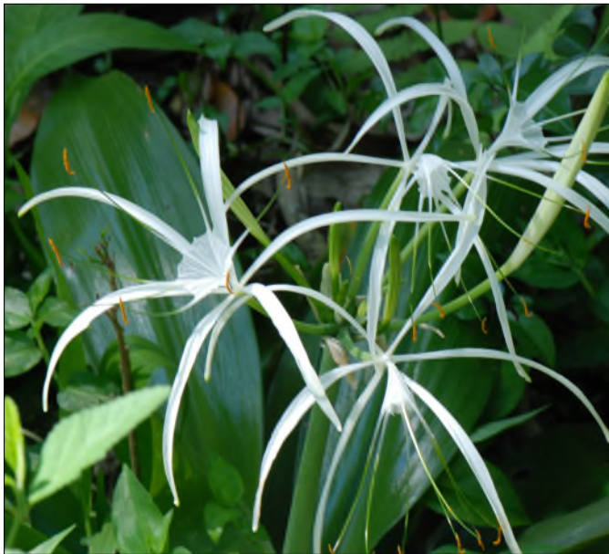
Fig. 29 - Hymenocallis caribaea