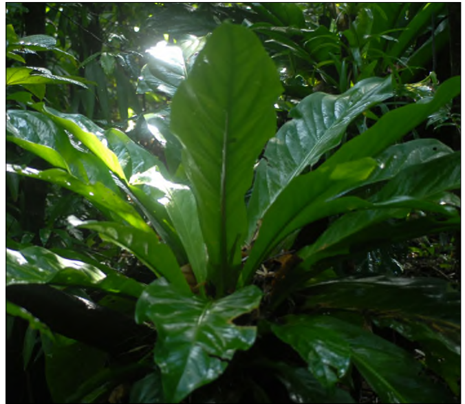
Fig. 59 - Anthurium hookeri

- Ichnanthus pallens (Swartz) Munro ( Poaceae ) : très abondant dans toutes les lisières forestières, herbe basse émettant des racines diffuses aux nœuds.