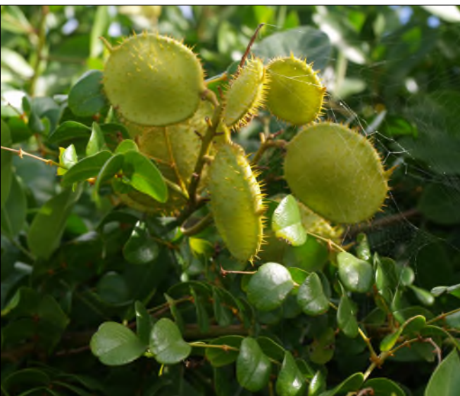
Fig. 36 - Caesalpinia ciliata