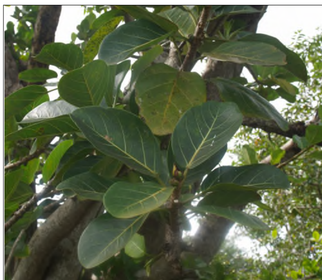
Fig. 25 - Ficus nymphaeifolium sur Pterocarpus