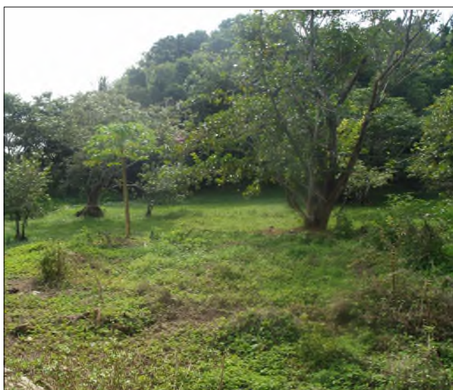
Fig. 24 - Bas-fond inondé à Gosiers