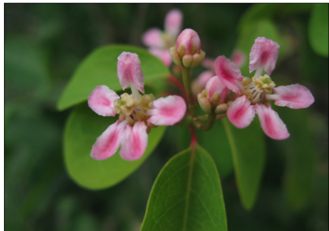
Fig.61 - Heteropteris purpurea