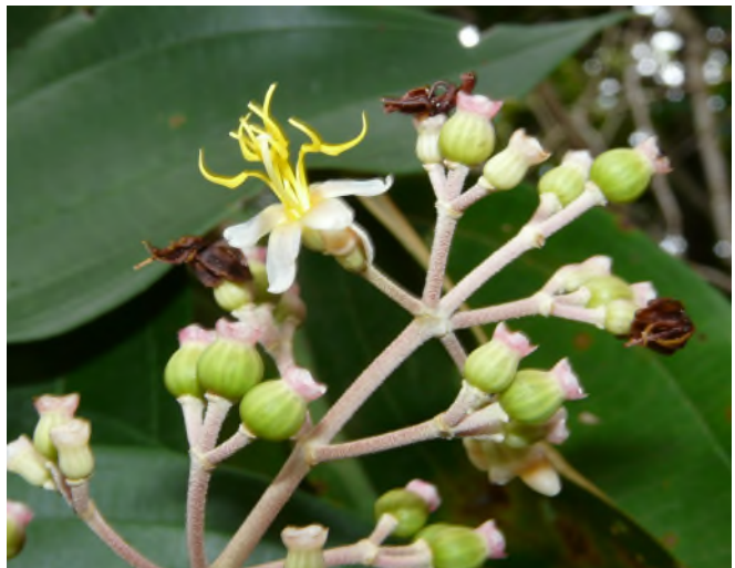
Fig. 81 - Miconia laevigata