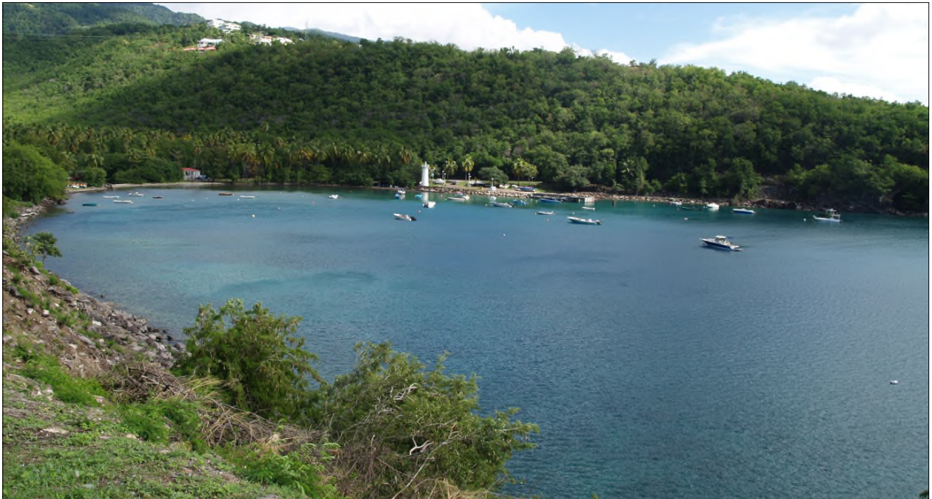
Fig. 69 - Anse à la Barque