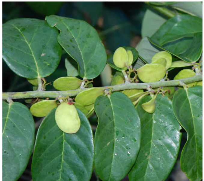
Fig. 73 - Dalbergia ecastaphyllum