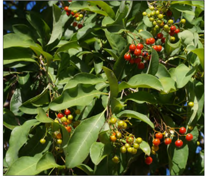
Fig. 10 - Bourreria succulenta