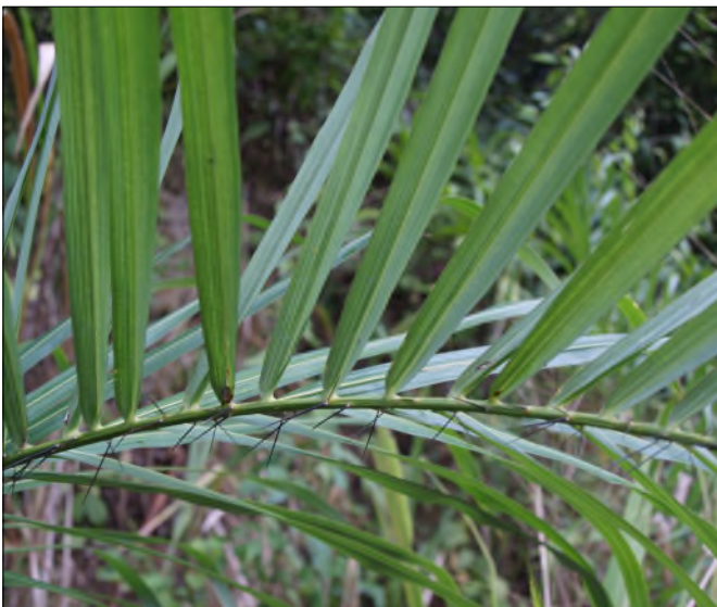
Fig. 33 - Acrocomia karukerana