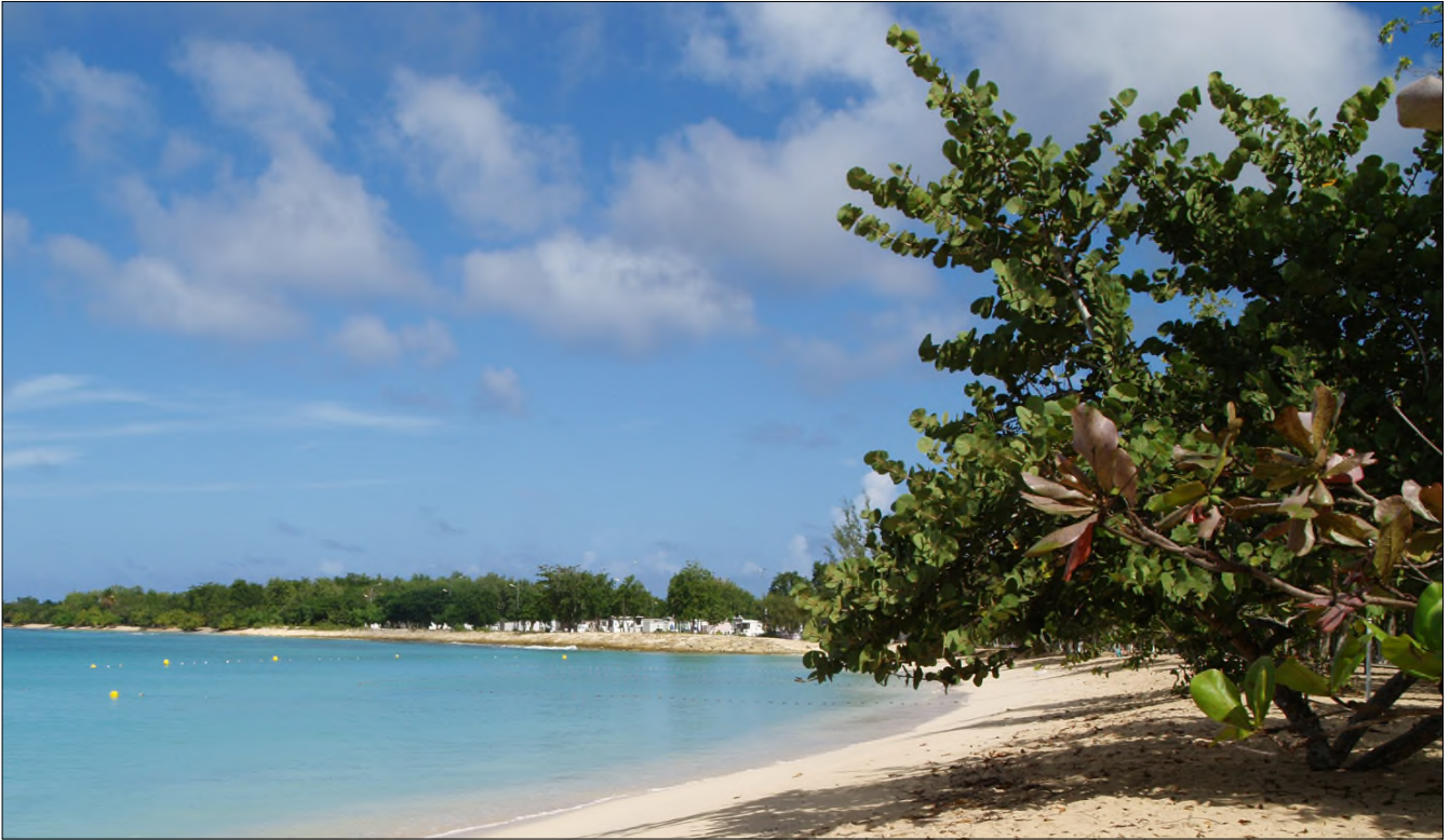
Fig. 1 - Plage du Souffleur à Port-Louis

- Azadirachta indica A. Juss. ( Meliaceae ) : « lilas blanc ».