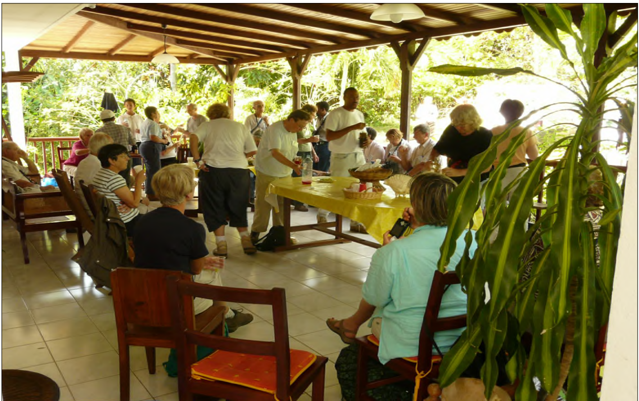
Fig. 86 - Fin de session le 4 février 2008