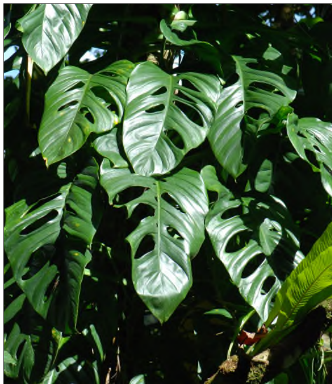
Fig. 46 - Monstera adansonii