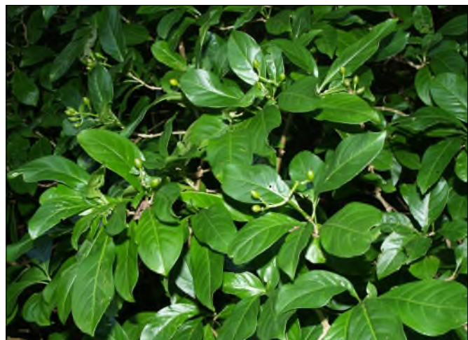
Fig. 54 - Psychotria microdon