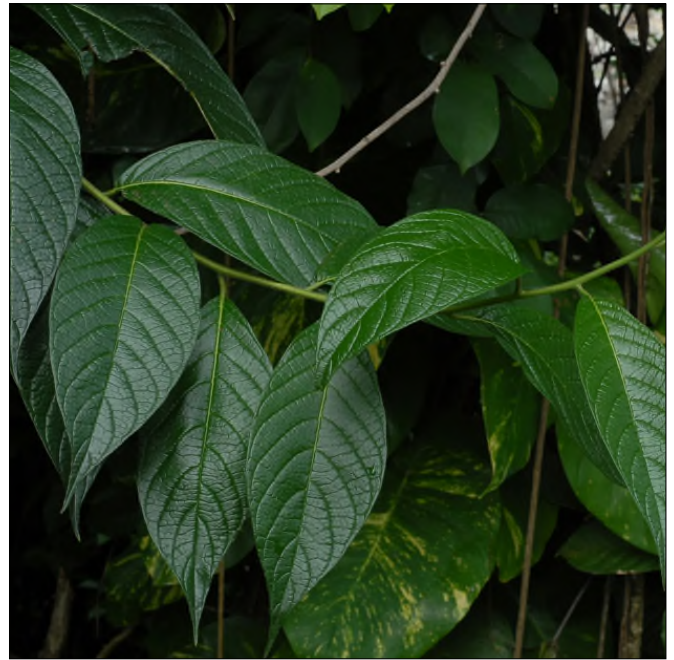
Fig. 68 - Tournefortia bicolor