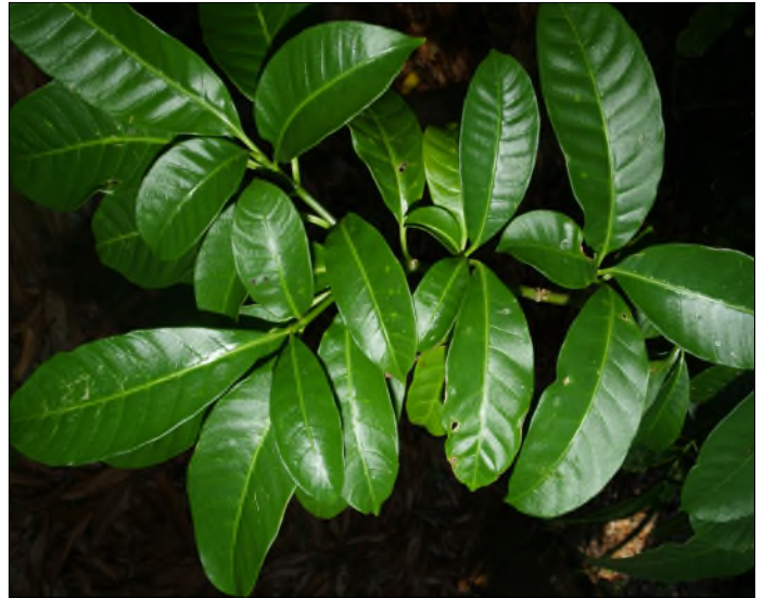
Fig. 55 - Tabernaemontanae citrifolia