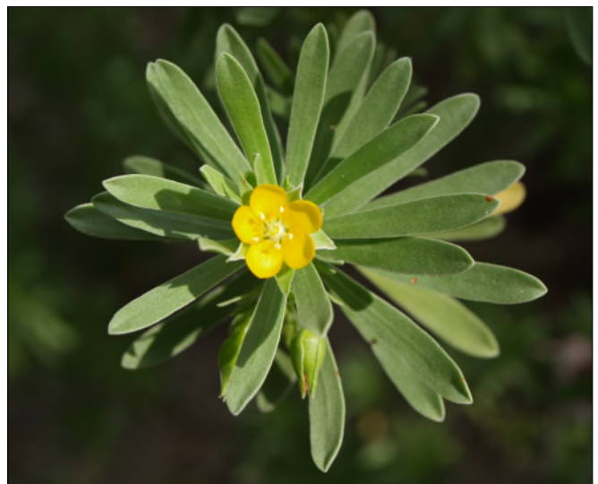
Fig. 24 - Suriana maritima

Endémique. Ne possède pas de grosse écaille sous le tympan, contrairement à l'iguane commun, elle est remplacée sur la mâchoire inférieure par une série d'écailles de même taille qui se prolonge jusqu'à l'extrémité du museau. Les épines du fanon (10 maximum) se situent uniquement dans la moitié supérieure. La queue est unie (elle est annelée chez l'iguane commun). Les jeunes et les femelles sont vert pomme, sans aucun dessin. Avec le temps, cette coloration tourne au brunâtre. La coloration des mâles adultes est brunâtre uniforme, marron, parfois grise. Il est arboricole, il consomme des feuilles, des fleurs, des fruits, y compris ceux du mancenillier, arbre très toxique !... Il vit au moins 15 ans. En