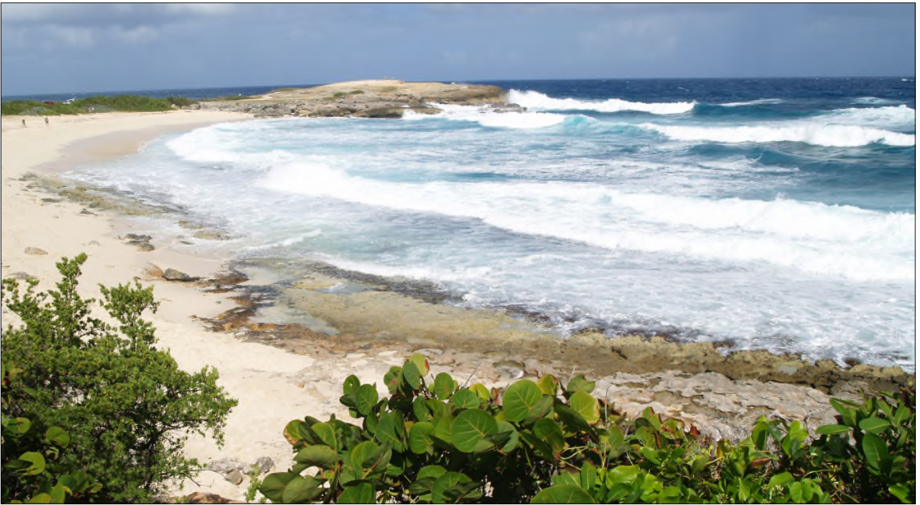
Fig. 35 - Plage de la pointe des Châteaux