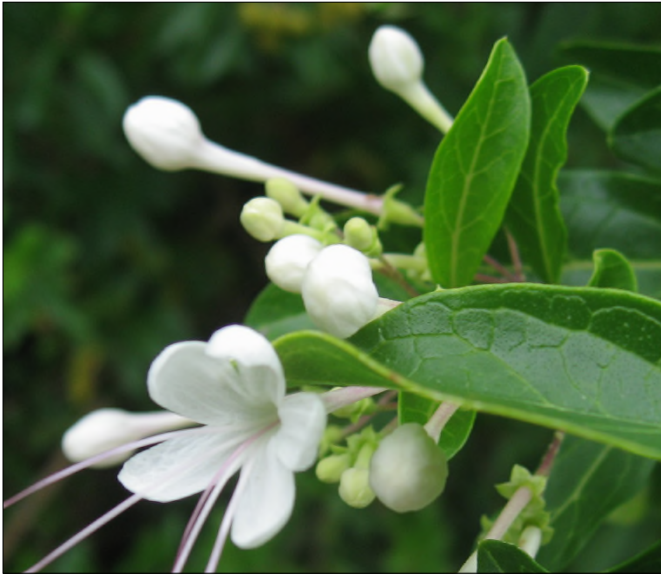
Fig. 42 - Clerodendron aculeatum