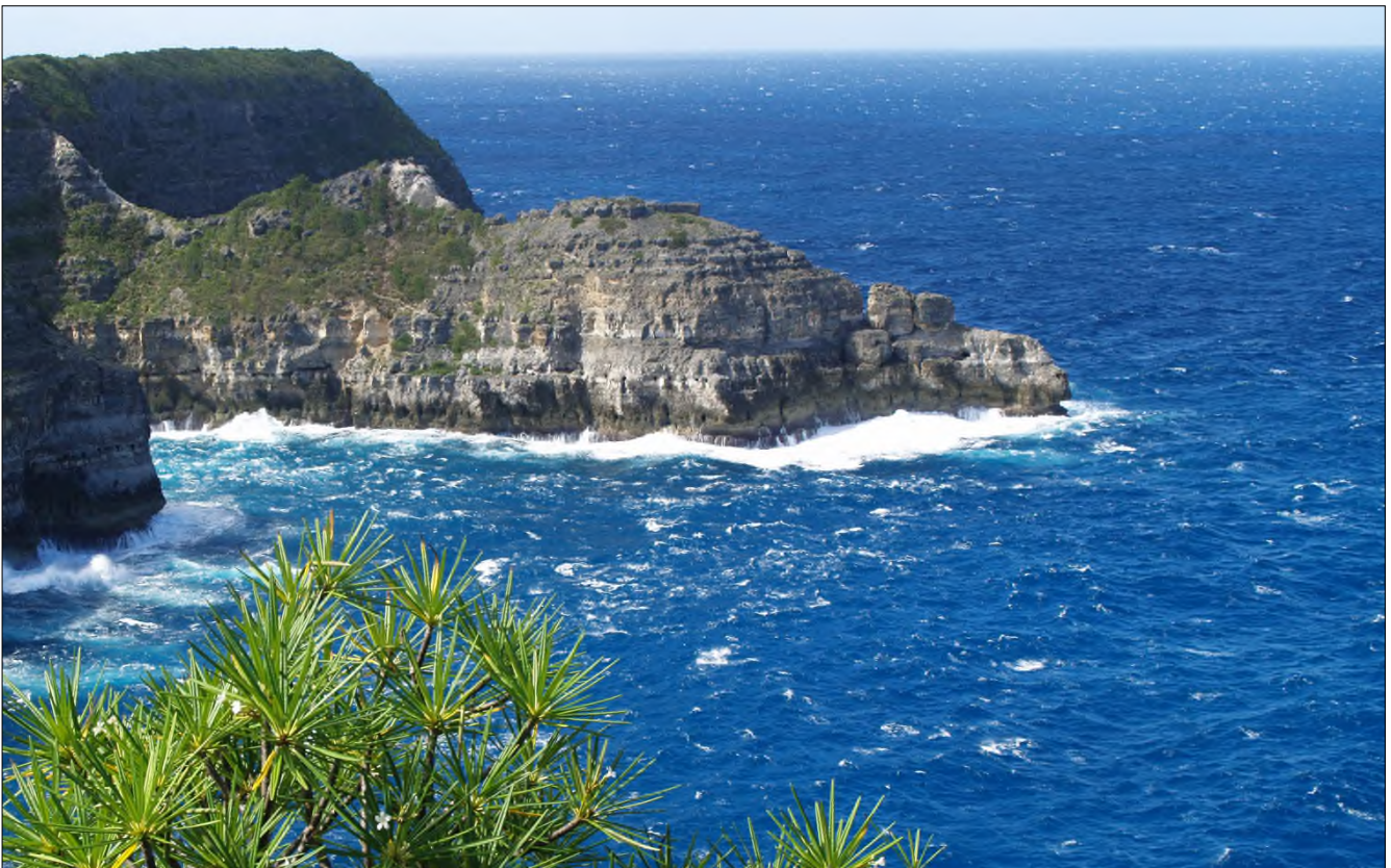
Fig. 9 - La Grande Vigie : rocher de la tortue et le Plumeria alba