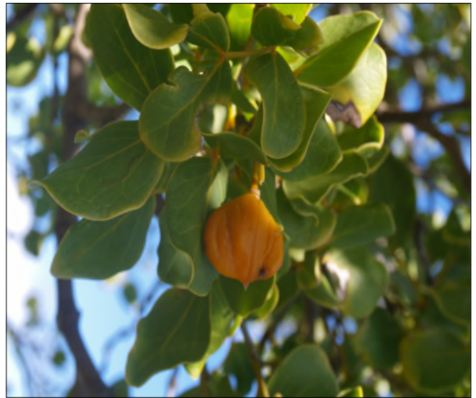
Fig. 22 - Guaiacum (fruit)