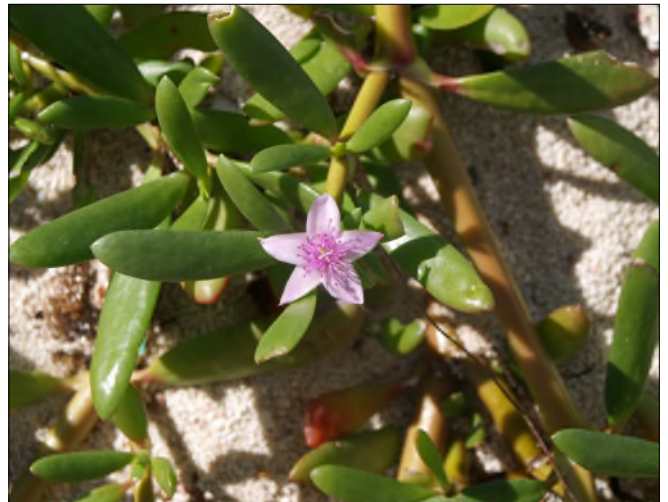
Fig. 23 - Sesuvium portulacastrum

Beaucoup de Bernards l'Ermitte (on les appelle des « soldats »), des algues.