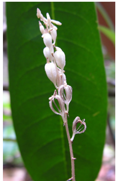
Fig. 63 - Wulfschlaegelia aphylla