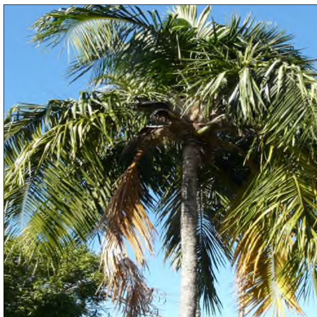
Fig. 58 - Syagrus amara

Le car ne peut pas monter au dernier parking (1.142 m), il nous dépose juste en dessous de l'aire de pique-nique de Beausoleil, 748 m.