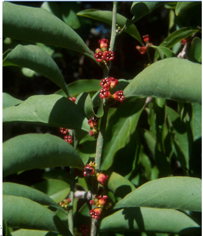
Fig. 8 - Schoepfia schreberi