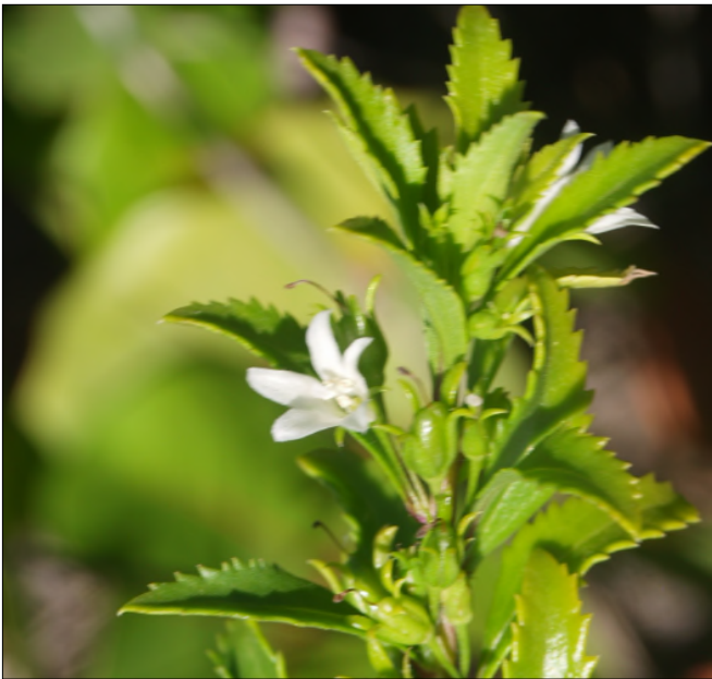
Fig. 19 - Capraria biflora