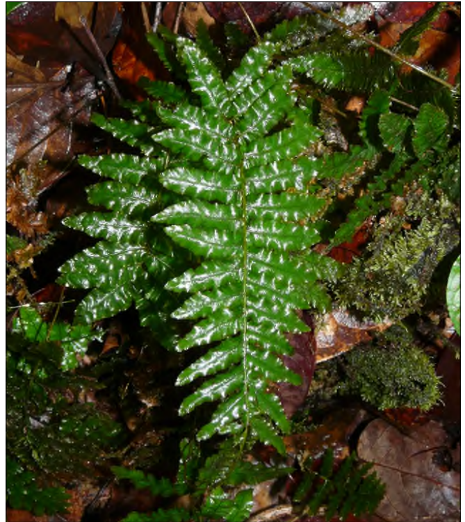
Fig. 83 - Trichomanes kraussii