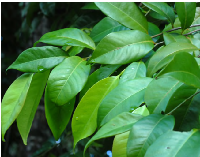
Fig. 76 - Amanoa caribaea

- Byrsonima trinitensis A. Juss. ( Malpighiaceae ) (Fig. 77) : endémique des Petites Antilles, le « Bois-tan rouge », à ramification très particulière, du type « terminal branching »..