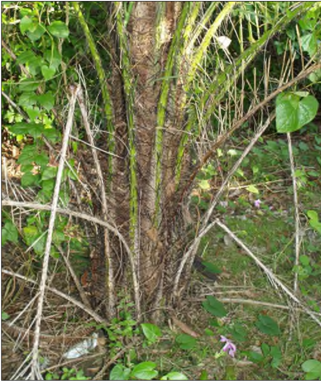
Fig. 74 - Acrocomia aculeata