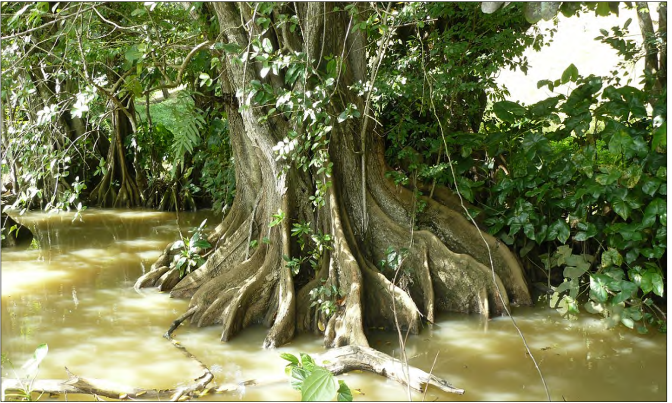
Fig. 26 - Pterocarpus officinalis (les contreforts plongent directement dans la nappe aquatique)