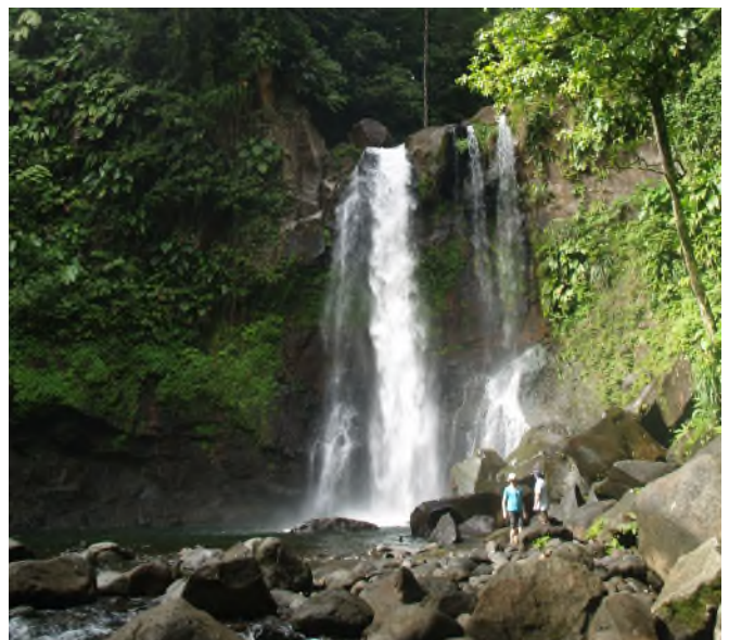
Fig. 52 - 3 e chute du Carbet