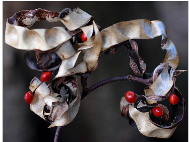
Fig. 71 - Adenantha pavonina