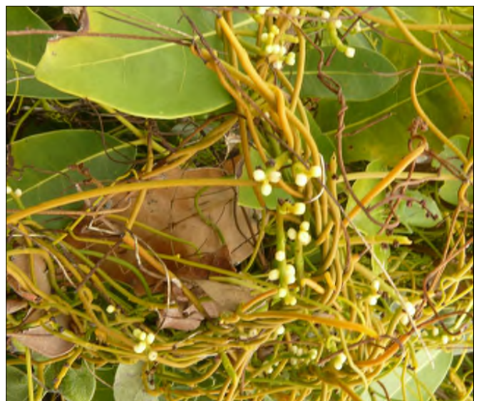
Fig. 37 - Cassytha filiformis