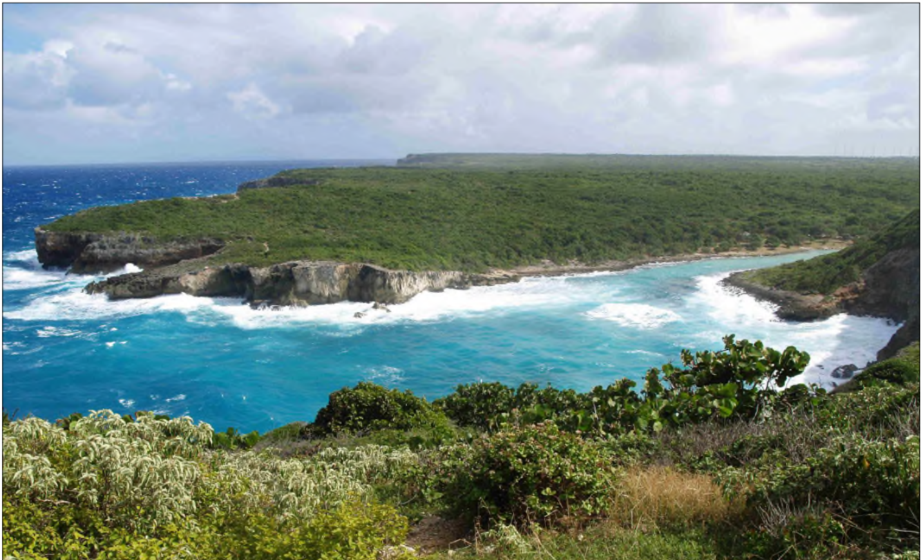
Fig. 13 - Panorama sur la porte d'Enfer