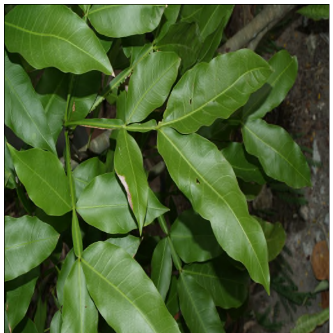
Fig. 2 - Melicoccus bijugatus

- Coccoloba uvifera (L.) L. ( Polygonaceae ) : (cf. les gaines : ochréas !), « raisinier bord de mer », grandes feuilles