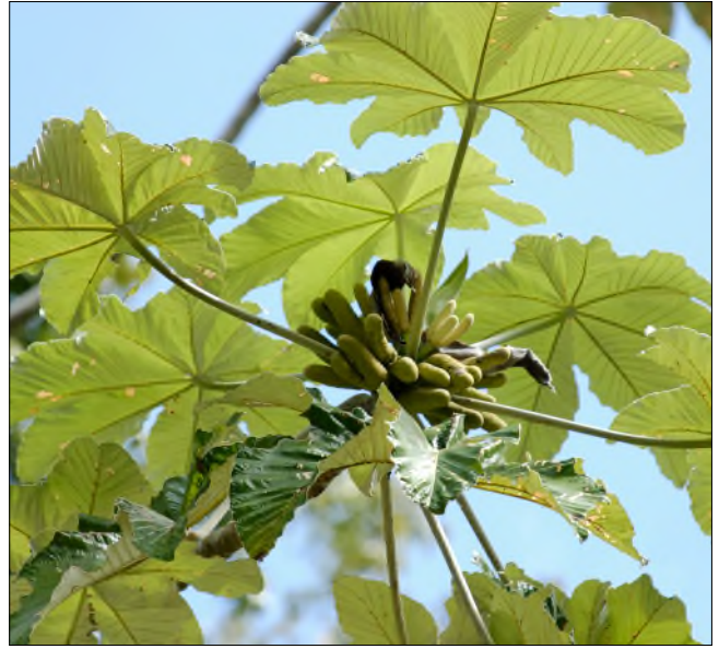
Fig. 79 - Cecropia schreberiana