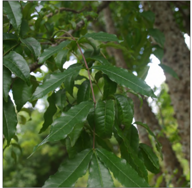
Fig. 32 - Zanthoxylum caribaeum