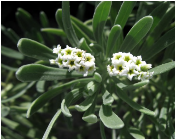
Fig. 17 - Argusia gnaphaloides