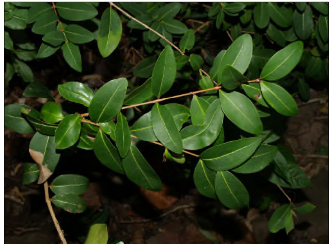
Fig. 53 - Eugenia cordata