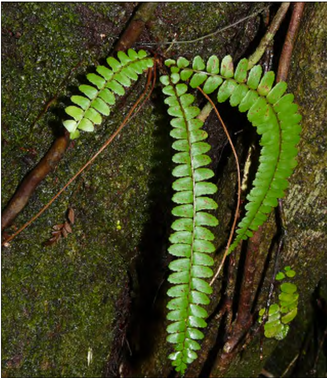
Fig. 82 - Nephrolepis rivularis