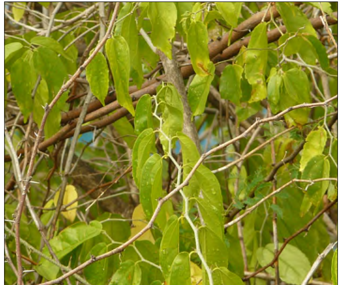
Fig. 64 - Celtis iguanaea

- Croton corylifolius ( Euphorbiaceae ).