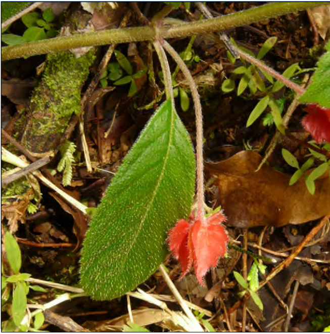
Fig. 47 - Alloplectus cristatus