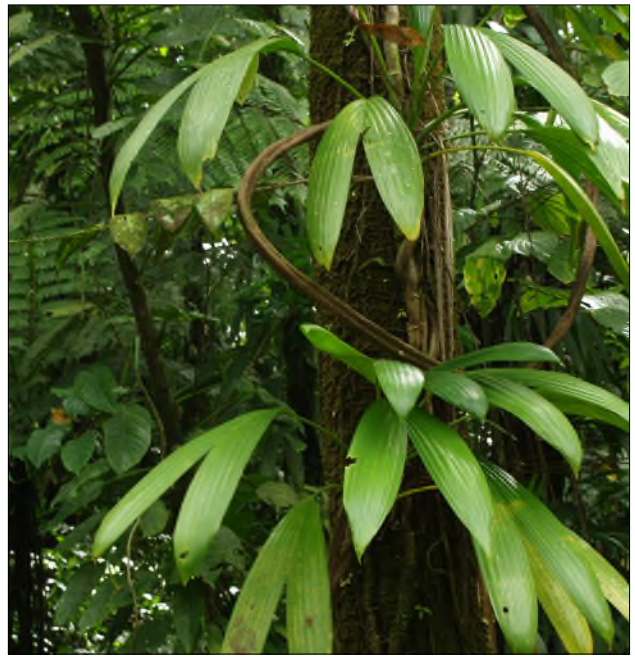
Fig. 48 - Asplundia rigida (Epiphyte)