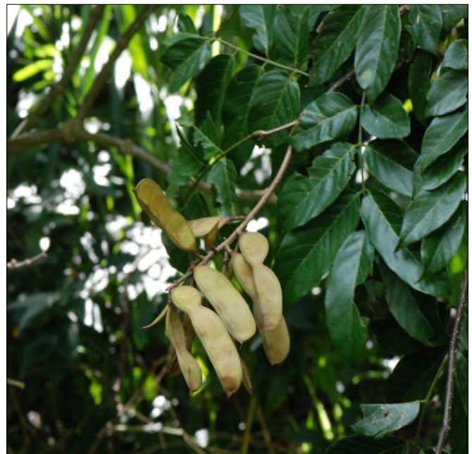
Fig. 28 - Lonchocarpus domigensis