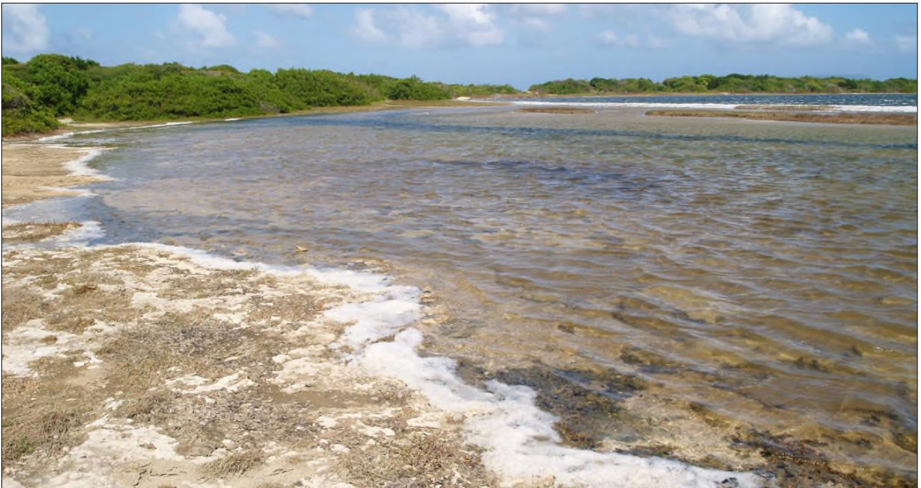
Fig. 41 - La Grande Saline