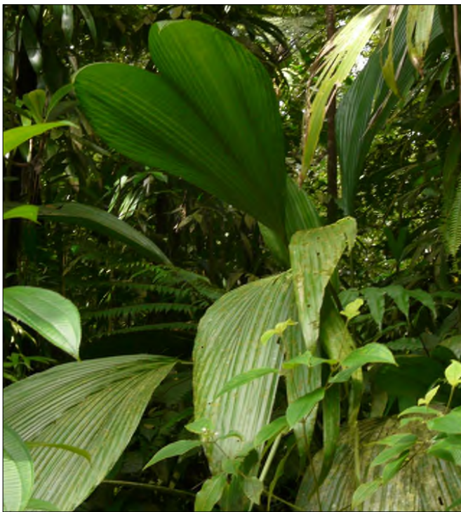
Fig. 49 - Asplundia insignis (terrestre)