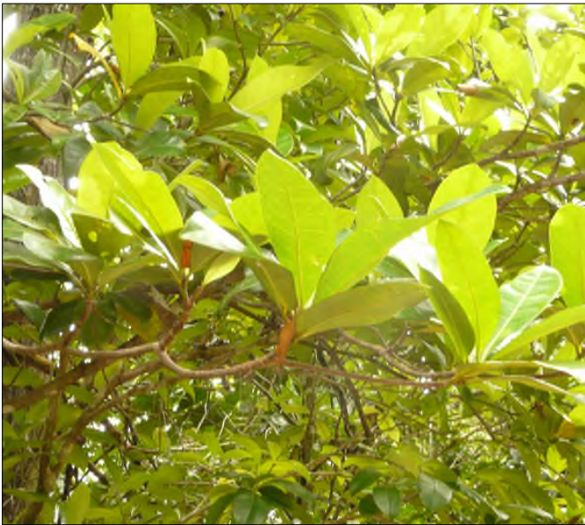
Fig. 78 - Byrsonima trinitensis