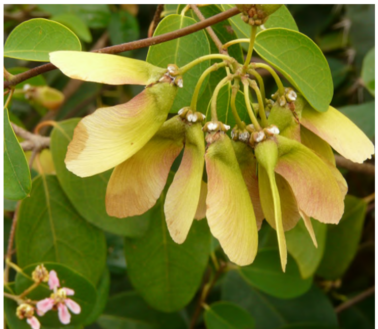
Fig. 70 - Heteropteris purpurea