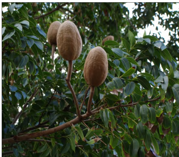
Fig. 3 - Swietenia mahagoni

- Thespesia populnea (L.) Solander ( Malvaceae ) (Fig. 4) : « catalpa », « calpata ». Arbre typique du littoral, souvent confondu avec le mancenillier, grandes fleurs jaunes devenant roses en fin de journée, visibles presque toute l'année, fruits secs déhiscent à carpelles soudés, feuilles cordiformes.