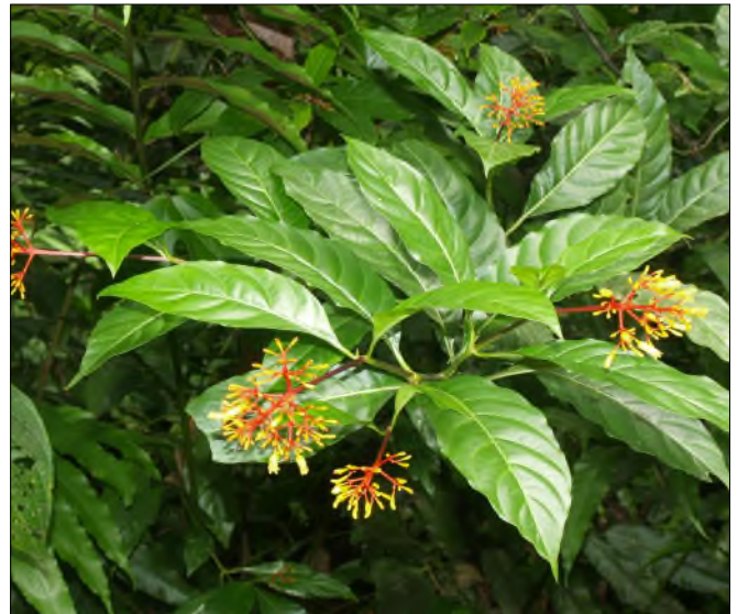
Fig. 51 - Palicourea crocea