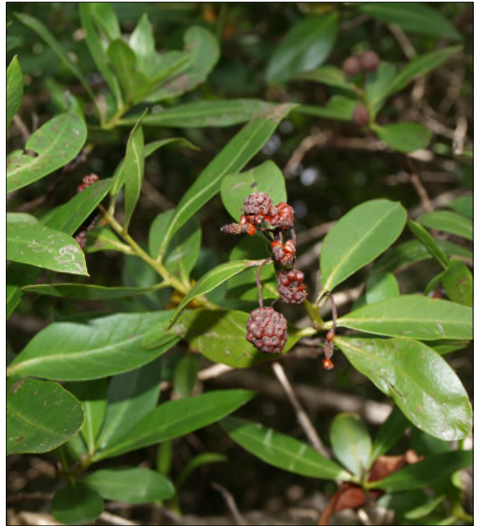
Fig. 6 - Conocarpus erectus

- Aechmea lingulata (L.) Baker (Bromeliaceae).