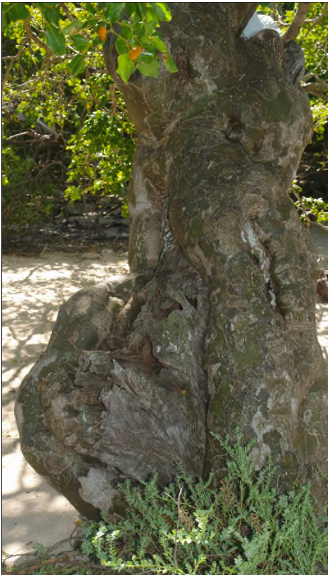
Fig. 21 - Guaiacum officinale