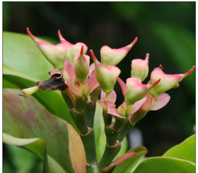
Fig. 44 - Pedilanthus tithymaloides