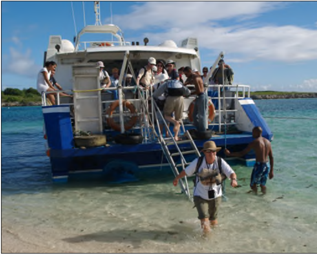
Fig. 15 - Débarquement sur Petite Terre