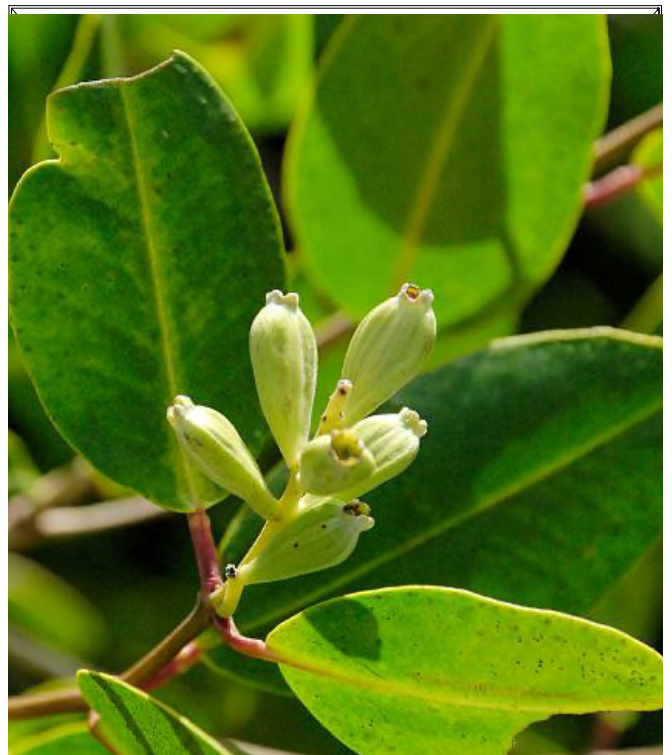
Fig. 7 - Laguncularia racemosa