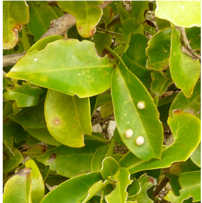
Fig. 12 - Pisonia fragrans