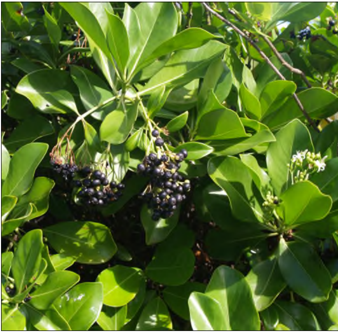
Fig. 38 - Erithalis odorifera