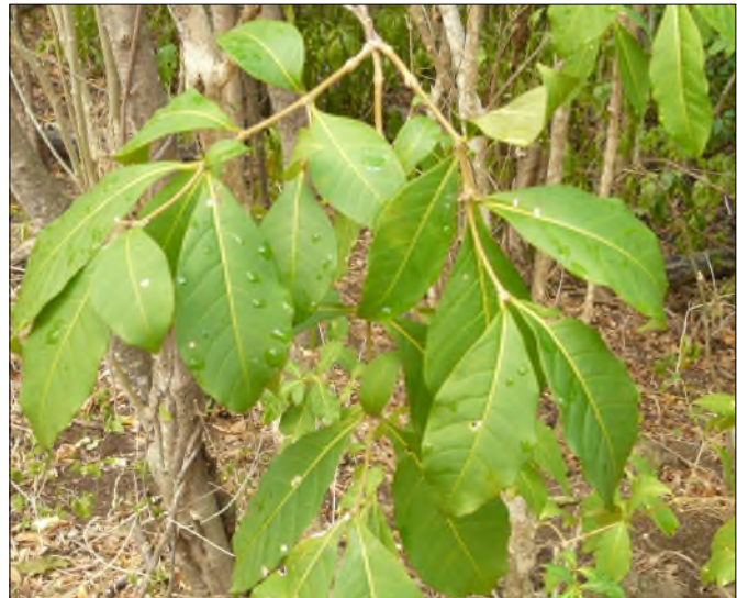
Fig. 65 - Rauwolfia viridis