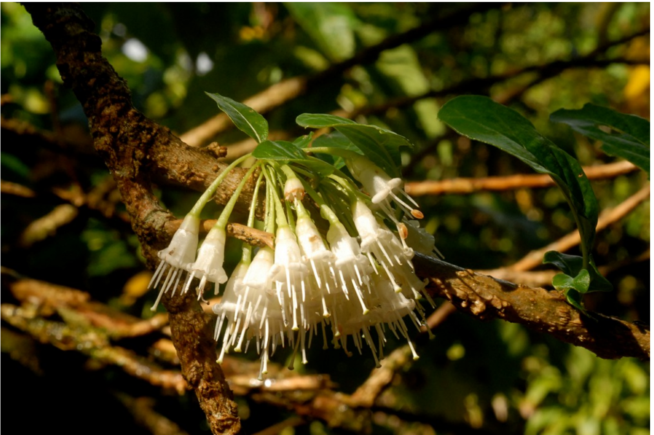
Acnistus arborescens (L.) Schlecht. ( Solanaceae )

3 - C. R. de la 142 e session de la SBF à la Guadeloupe : 123-166, 2011