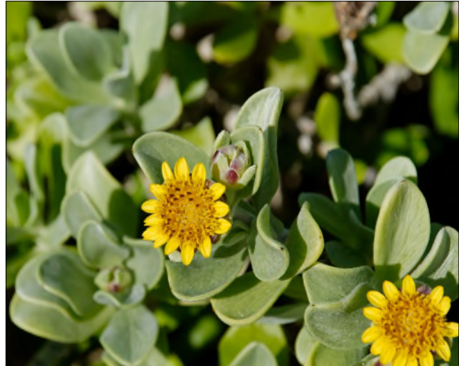
Fig. 18 - Borrchia arborescens