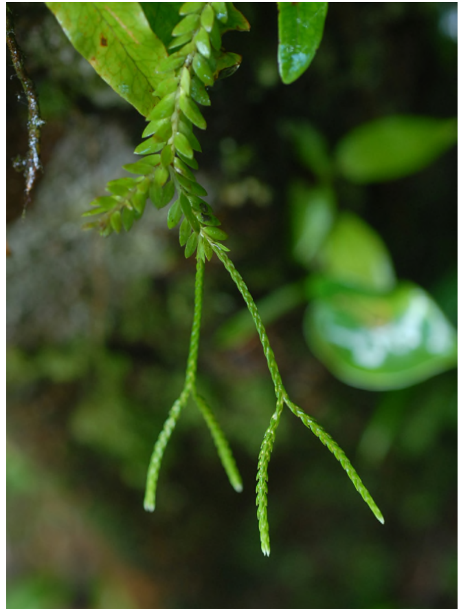
Fig. 62 - Lycopodium taxifolium