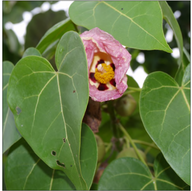
Fig. 4 - Thespesia populnea