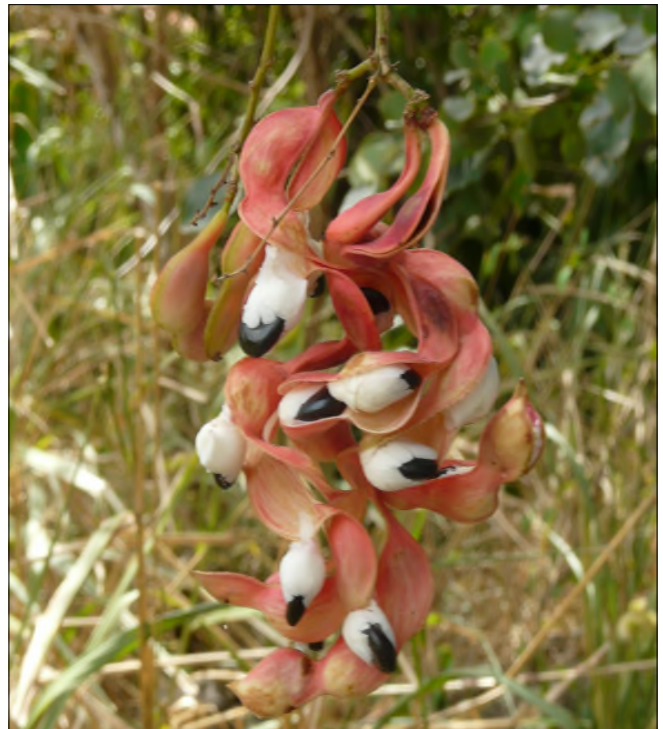
Fig. 57 - Pithecellobium unguis-cati (graines)