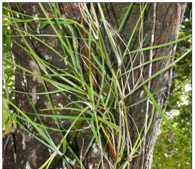
Fig. 85 - Scleria secans (épiphyte)