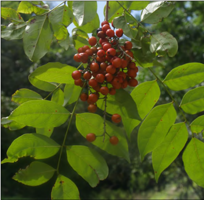
Fig. 31 - Picramnia pentandra