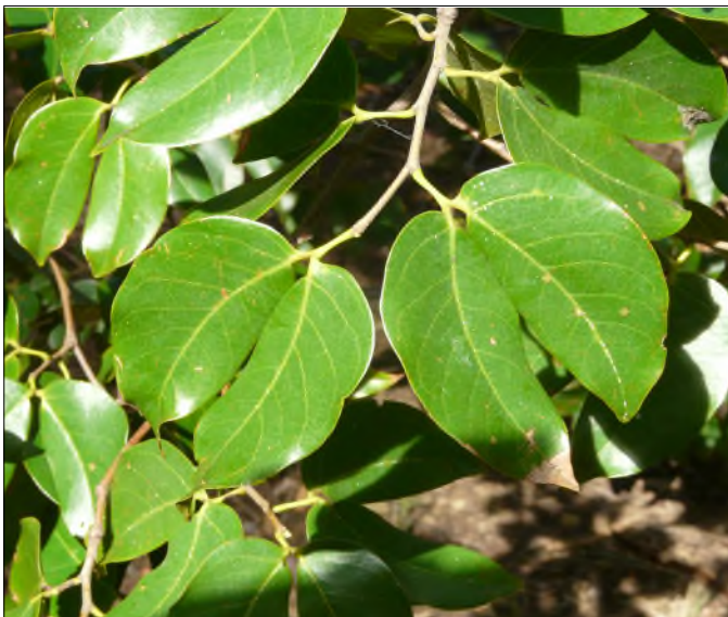
Fig. 56 - Hymenea courbaril