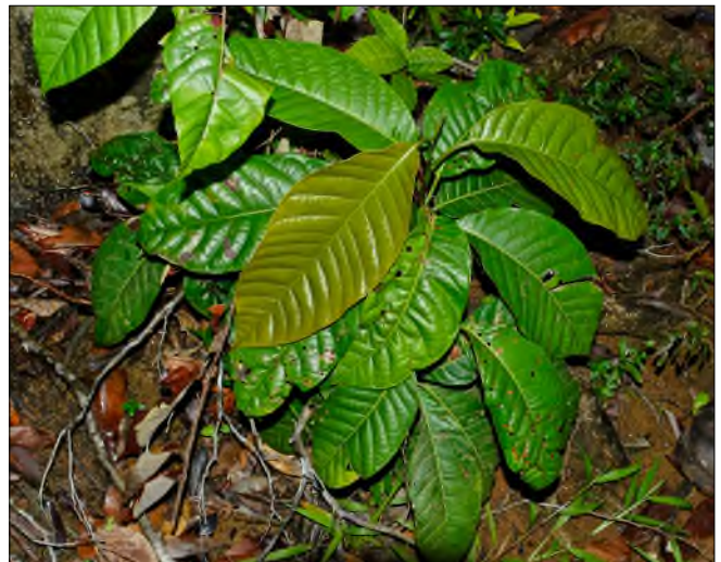
Fig. 80 - Coccoloba clusii