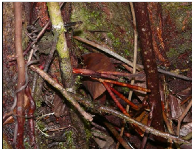
Fig. 77 - Racines adventives sur Amanoa caribaea