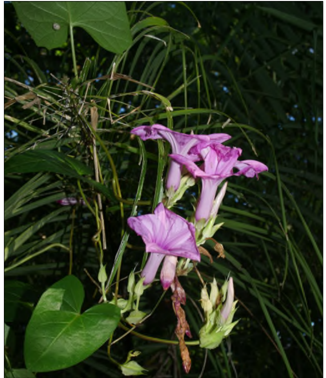
Fig. 75 - Ipomoea purpurea