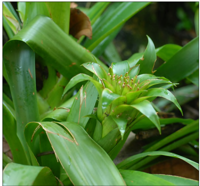
Fig. 60 - Guzmania lingulata