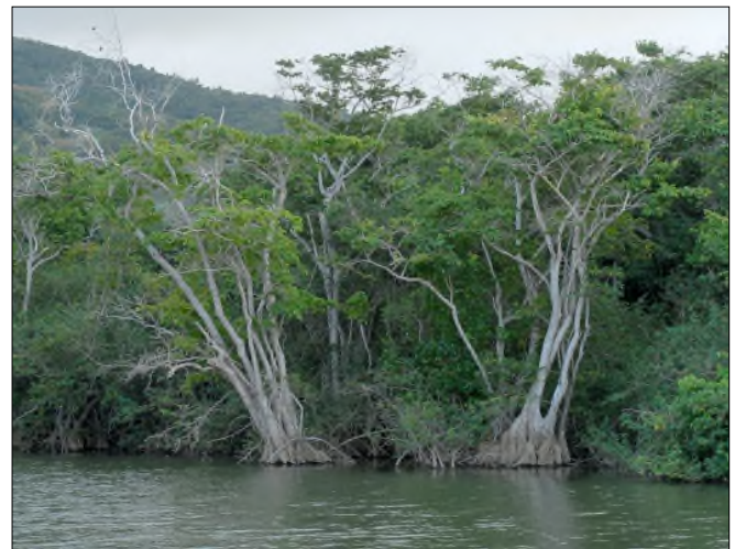
Fig. 72 - Annona glabra