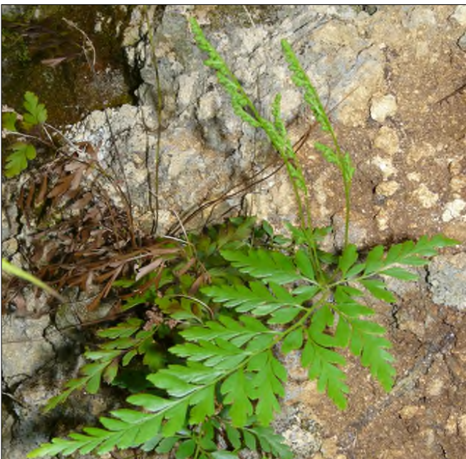
Fig. 27 - Anemia adiantifolia