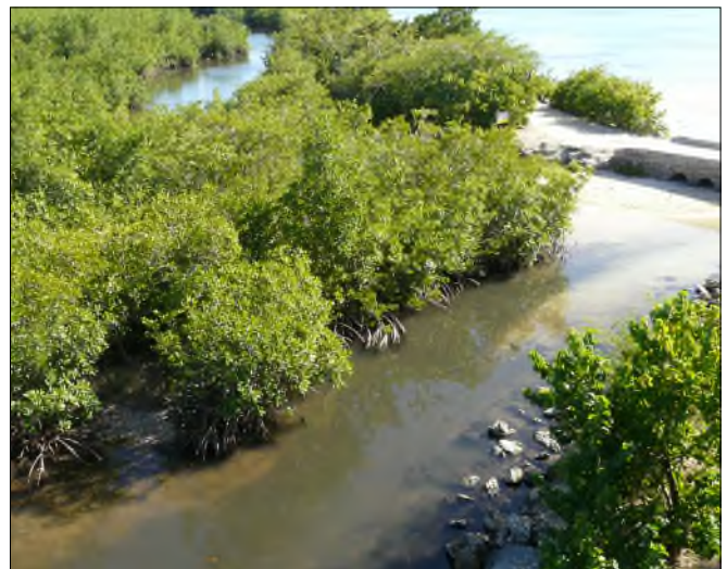
Fig. 5 - La Mangrove de la pointe des Mangle

Les mangroves couvrent une superficie d'environ 9600 ha en Guadeloupe. Elles se développent sur les rivages du Grand et du Petit Cul-de-Sac Marin et dans certains estuaires. Du front de mer vers l'intérieur des terres, on distingue tout d'abord la mangrove du bord de mer constituée par le palétuvier rouge ( Rhizophora mangle ), la mangrove arbustive composée de palétuviers rouges et de palétuviers noirs ( Avicennia germinans ) et la mangrove haute composée de palétuviers rouges, de palétuviers blancs ( Laguncularia racemosa ) et de palétuviers gris ( Conocarpus erectus ).