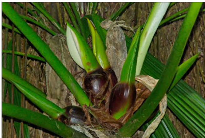
Fig. 45 - Philodendron giganteum