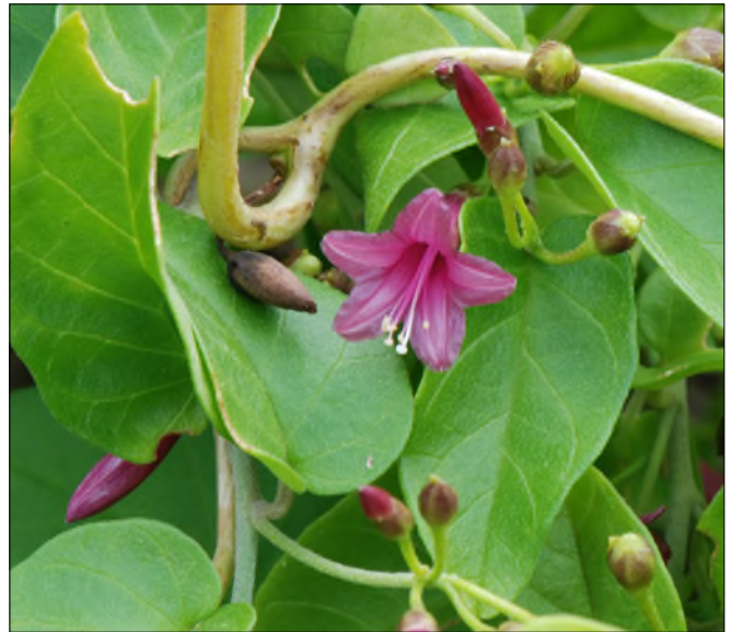
Fig. 43 - Jacquemontia pentantha