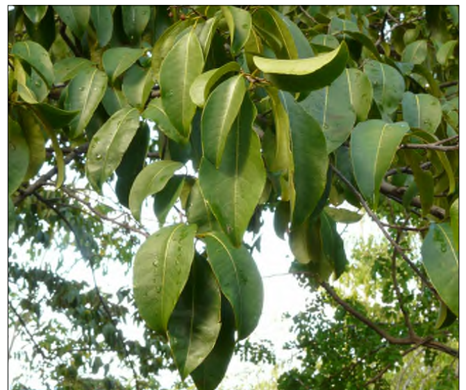
Fig. 66 - Zanthoxylum monophyllum