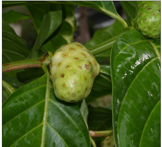
Fig. 30 - Morinda citrifolia