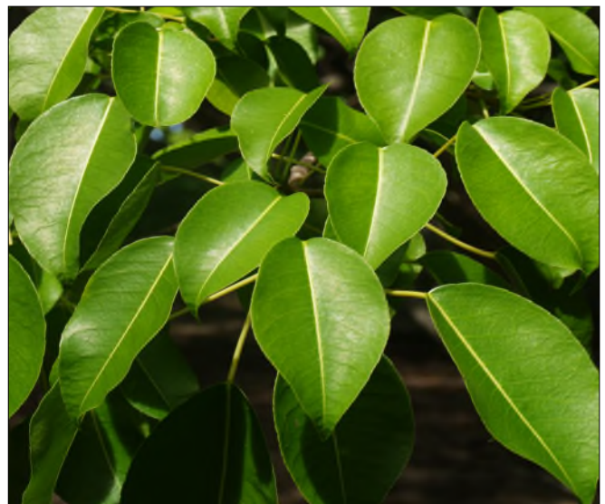
Fig. 14 - Hippomane mancinella

La plage (Fig. 16), le littoral, un étang salé et la végétation xérophile :