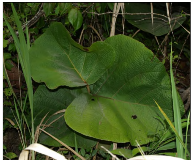
Fig. 34 - Cocoloba pubescens