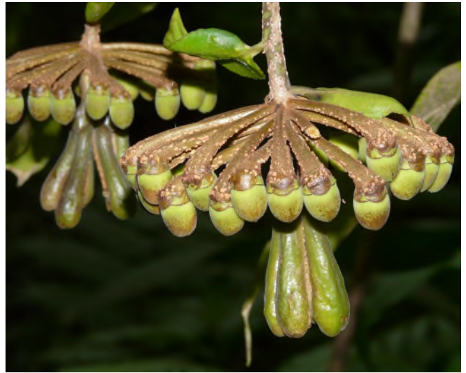
Fig. 50 - Marcgravia umbellata