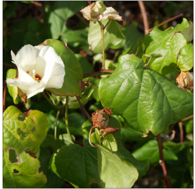
Fig. 39 - Gossypium hirsutum f. yucatanense