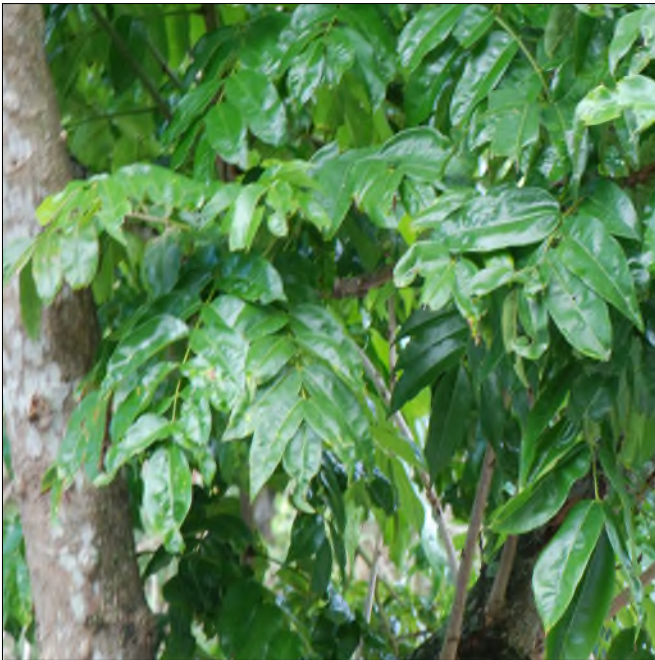
Fig. 67 - Andira inermis