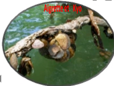
Huitres de palétuvier