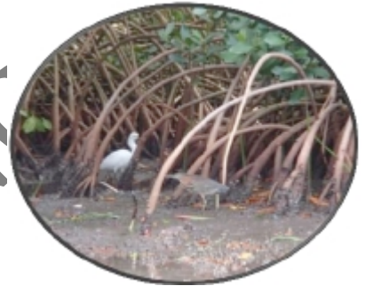
Aigrette et Kyo