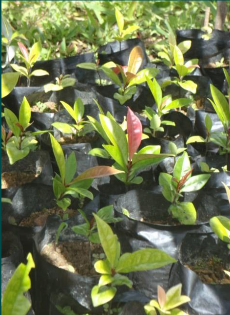
Plants de bois d'ébène 6 mois en pépinière