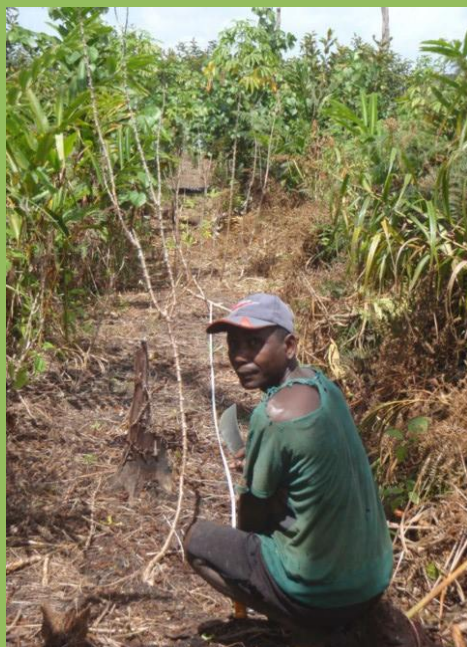
Nettoyage layons chez Lux Bemaniry à Andranomainty