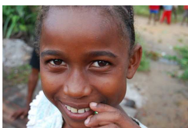
Fille du village d’Ambatobe