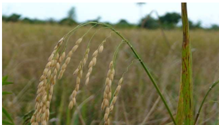
Riz prêt à être récolté

En parallèle de ces productions et plantations d'arbres, le projet va s'orienter vers une éducation des paysans afin de modifier progressivement leur système de culture du riz et lutter contre les brûlis excessifs des terres.