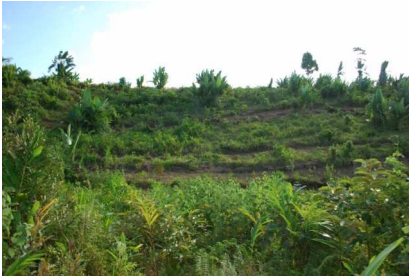
Terrain à reboiser

Les propriétaires de ces terrains se sont engagés à entretenir les nouvelles plantations et à ne pas les brûler. Ils obtiendront leur titre officiel de propriété du terrain à l'issue des 5 premières années si cet engagement est respecté.