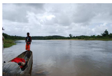
Fleuve Onive qui longe le village

Ambatobe marque le début d’une zone fortement vallonnée et accidentée. Les terrains de plantation sont pour la plupart des collines ayant été brûlées ( Tavy ) pour la culture du riz. La végétation spontanée qui repousse est très limitée, en particulier pour la strate arborée. Seul l’arbre du voyageur ( Ravenala madagascariensis ), arbre emblématique de Madagascar, se développe rapidement.