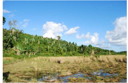
Terrain à reboiser derrière les rizières