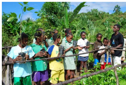
Atelier de sensibilisation des enfants