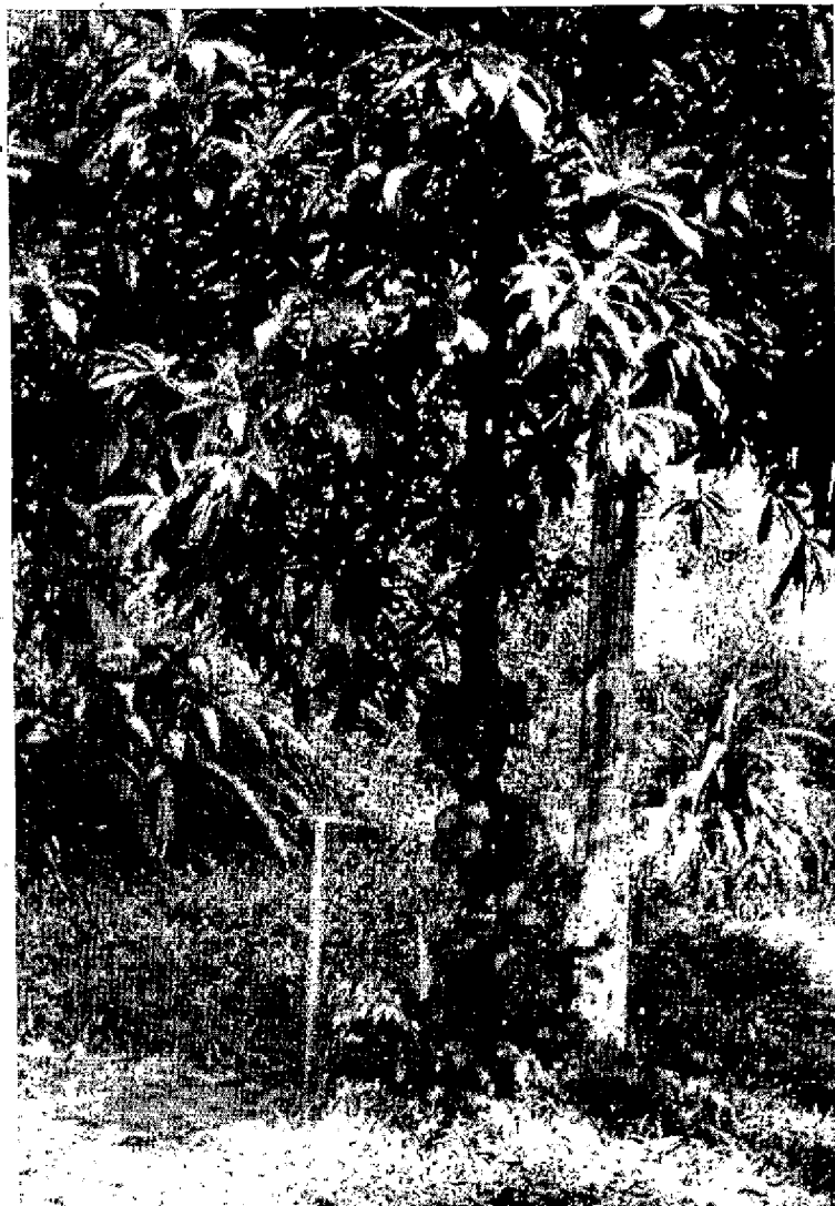
Cameroun. Ebénacée ( Diospyros sp.) portant ses fruits.

Vers la Côte birmane, dans les îles Andaman et Nicobar, il existe enfin un Ebénier de grande taille dont le bois est bien connu du marché anglais sous le nom d'Andaman Marblewood ( D. marmorata Parker). Il fournit un Ebène marbré de taches rectangulaires très noires qui tranchent sur fond clair et à cœur un bois veiné sur quartier alternativement de noir et de gris.