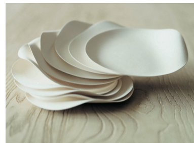
Assiettes rondes Kuku collection Wasara - Schinishiro Ogata - Virages