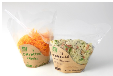
Salades Bio - Laure Choquet - BIOTIFOOD & CLEA