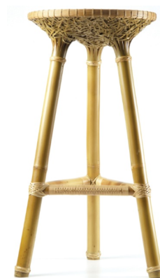
Tabouret BAMBOOL Chou Yu-Jui, Su Su-Jen & Chen Kao-Ming - Yii