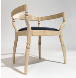
Fauteuil Fugue - Paul Lebach - Billiani SRL