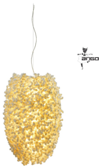
Suspension CASCADE Angus Hutcheson - Ango