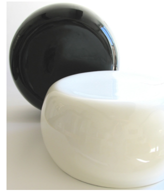
Pouf Mello - Boo Louis - Ekobo