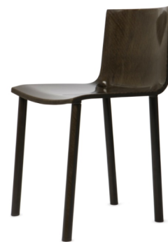
Chaise LIN94 - François Zambourg - DCS