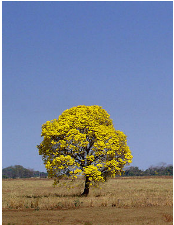
Ipê jaune ( Tabebuia chrysotricha )