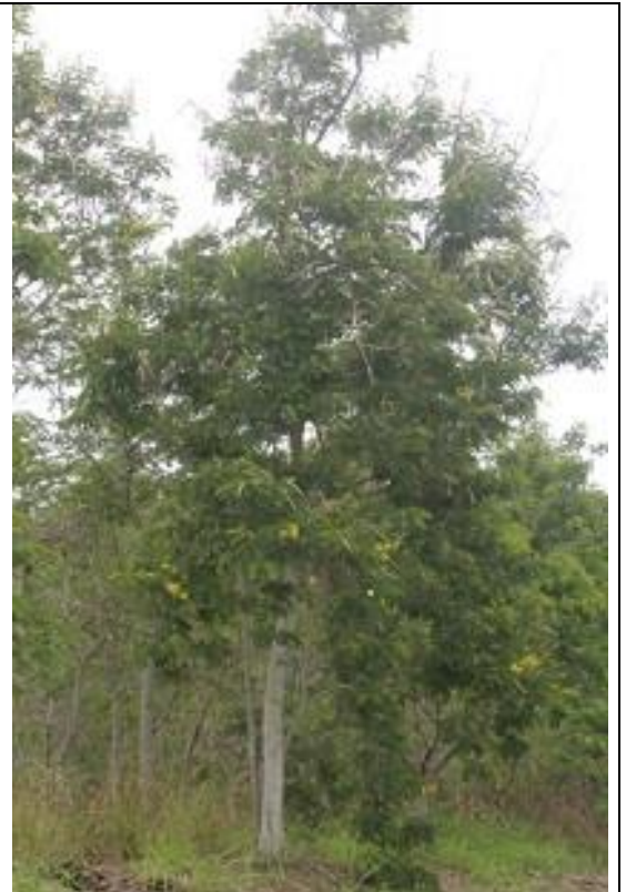
Photo de l'Arbre (Source : http://www.mi-aime-a-ou.com/cassia_du_siam.php ).

Régions d'introduction connues : Il a été largement introduit dans d'autres climats tropicaux humides à travers le monde. S. siamea est supposé être indigène dans le sud de l'Inde, au Sri Lanka, au Myanmar (Birmanie), en Thaïlande, au Cambodge, en Malaisie et dans des parties de l'Indonésie, avec une zone native entre 25° N et ° S. USDA-ARS (2007) où il a une distribution native plus restreinte, y compris l'Asie que sur le continent Sud-Est, avec le Vietnam, alors que ILDIS (2007) traite également l'Inde comme et le Vietnam en tant que parties de la zone introduite, ainsi que le Cambodge, mais ne comprend pas la Chine, le Sri Lanka et l'Indonésie dans la zone native. Bien qu'il n'y ait manifestement pas d'accord sur les limites exactes de l'aire de répartition naturelle, l'ILDIS (2007), mais c'est cette description qui est adoptée ici (Source : http://www.cabi.org/isc/datasheet/11462 ). Senna siamea , le cassia du Siam est présent à La Réunion à l'état cultivé, introduit il orne des parcs et des jardins créoles. Senna siamea a été planté par l'ONF dans la forêt de la Providence à Saint-Denis et dans la forêt de l'étang-Salé pour la fixation des dunes à La Réunion (Source : http://www.mi-aime-a-ou.com/cassia_du_siam.php ).