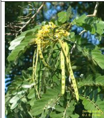
En fleur.