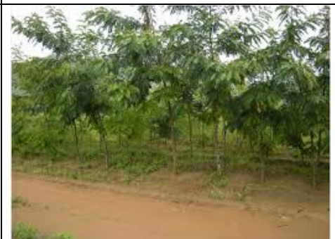
Parcelle villageoise, pour le bois, de Senna siamea , Kapatakafinye Village, dans la zone frontalière de Nyika National Park.