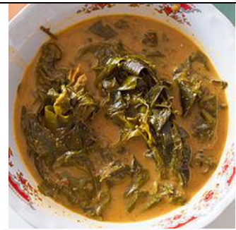
. Kaeng khilek , un curry thaï fait avec des feuilles et boutons de fleurs de kassod (Cassia du Siam).

http://www.centralafricanplants.senckenberg.de/root/index.php?page_id=34&id=3056