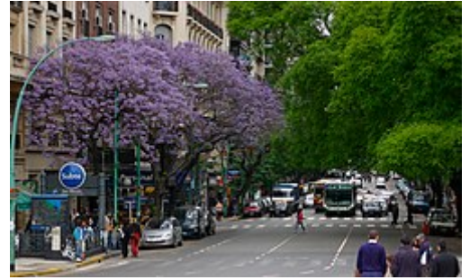
Jacaranda sp. à Buenos Aires , Argentine