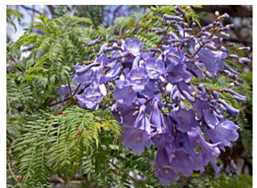
Fleurs de Jacaranda sp.