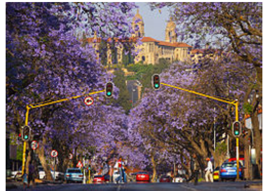
Rue bordée de jacarandas à Pretoria