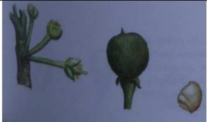
Fruits, graines.