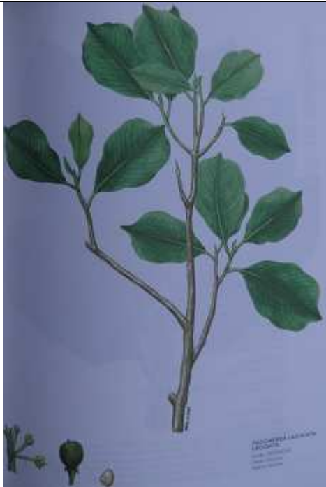
Image des feuilles (Source : l'Homme et l'environnement). (à vérifier).