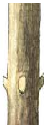
PODA INCORRECTA (FORMACIÓN DE MUÑONES)