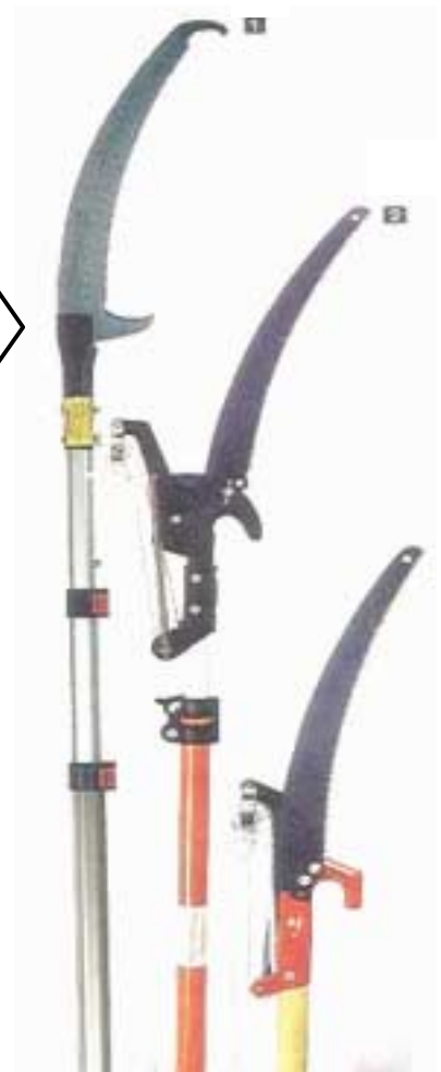
SERRUCHOS MONTADOS EN PERTIGAS TELESCOPICAS