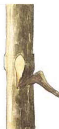
PODA INCORRECTA (DESGARRE DE RAMAS)