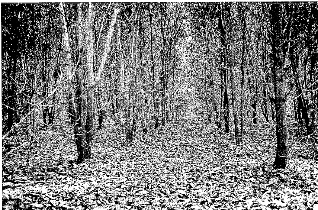
Sous-bois d'une plantation d' Acacia mangium âgée de cinq ans, Loandjili, Congo.