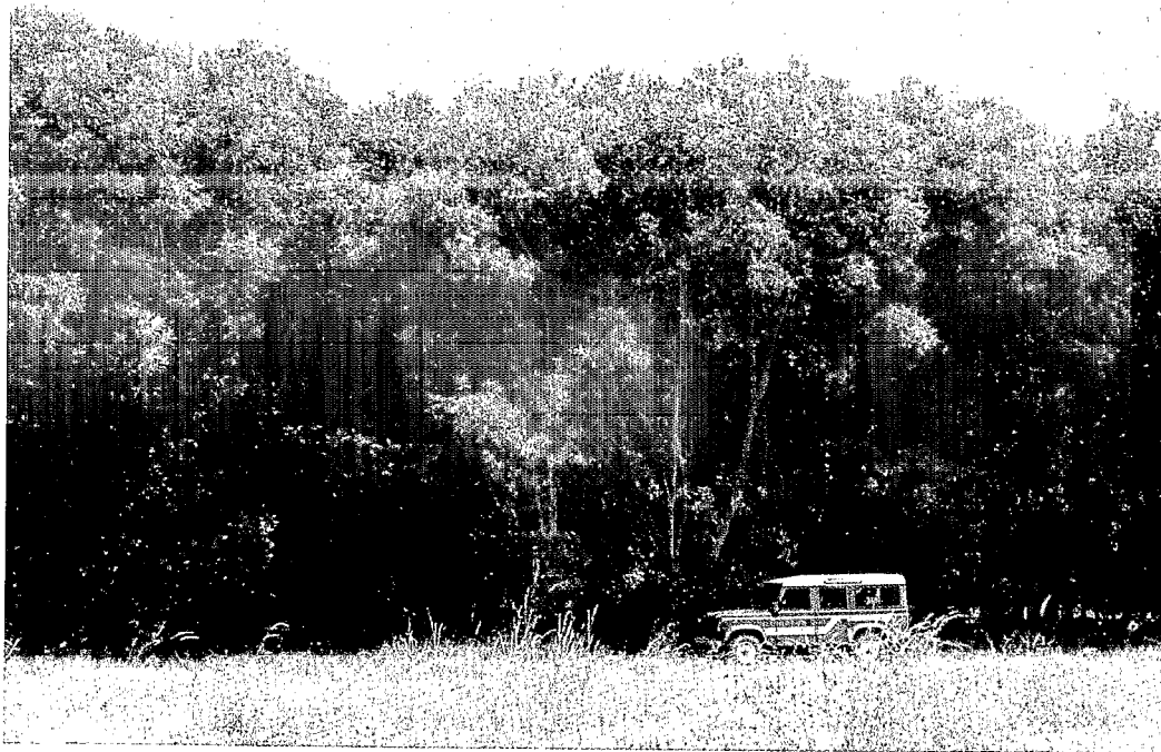
Plantation d' Acacia mangium âgée de cinq ans, Loandjili, Congo.