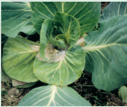
Pourriture blanche due à Sclerotinia sur chou

spongieux et se couvrent d'un mycélium blanc cotonneux caractéristique, dans lequel de nombreux sclérotés se forment, d'abord blancs puis noirs.