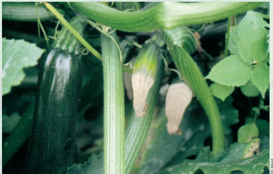
Dégâts de Botrytis sur fruits de courgette

• Dissémination : air (longues distances)