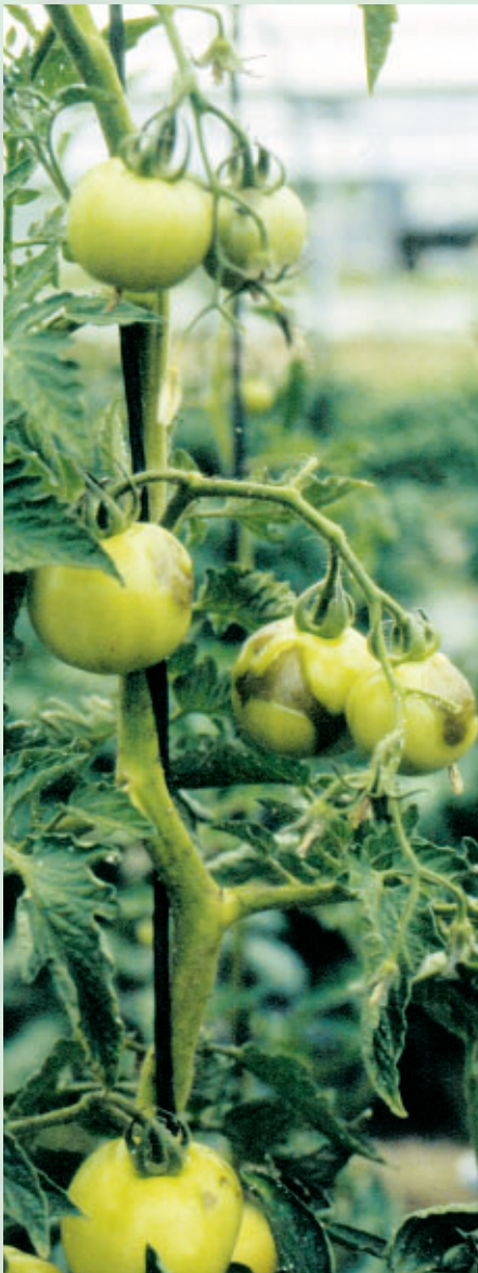
Taches sur fruits de tomate dues au Virus de la Mosaïque du Concombre

piment), épinard, laitue. La maladie est d'apparition irrégulière, imprévisible, suivant les régions et les années. Elle est transmise par puceron selon le mode non persistant.