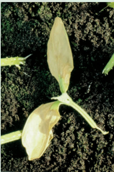
Fonte de semis sur concombre

Les tissus infectés ramollissent, deviennent