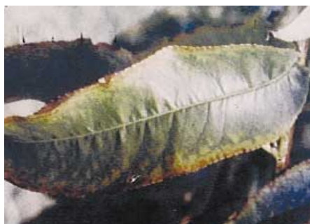
Carence en potassium sur pêcher