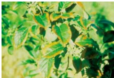
Carence en potassium sur pommier

Les deux apports sont nécessaires : même après dix ans, l'apport annuel ne compense pas l'absence de fumure de fond et réciproquement.