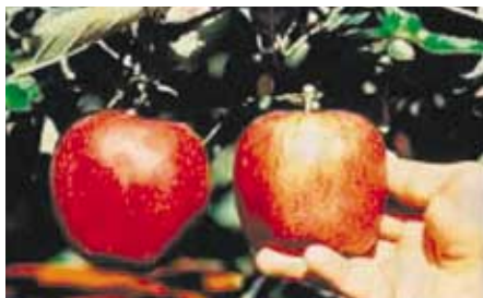
A gauche un fruit d'un verger fertilisé au sulfate de potassium, à droite le témoin

Le sulfate de potassium par son action sur le transport des sucres depuis les feuilles jusqu'aux organes de stockage, influe sur le calibre des fruits. Le résultat de l'expérimentation suivante montre l'effet positif du sulfate de potassium sur le calibre des pommes. Son action est également notable sur la teneur en sucre et sur l'équilibre sucre/acidité, facteurs importants de la saveur des fruits.