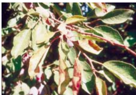
Carence en potassium sur prunier