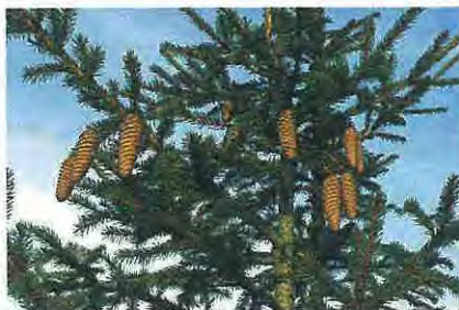
→ cônes pendants d'un épicéa

■ Il supporte tous les types de sols même partiellement engorgés.