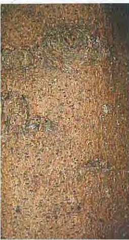
→ écorces jeune et âgée