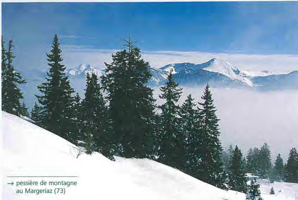
→ pessière de montagne au Margeriaz (73)

Vous êtes propriétaire d'épicéa ( Picea abies ), une essence productive adaptée aux conditions de montagne.