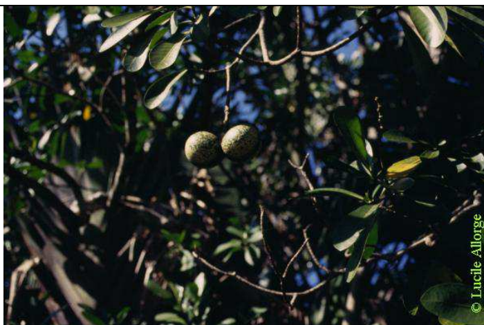
Voacanga thouarsii , dans l'Isalo (Madagascar) © Copyright Lucile Allorge 2003

Source : Fiche 904 - Voacanga thouarsii Roem. et Schult. ( Apocynaceae ), dans le CD-Rom Plantes médicinales de Madagascar de Pierre Boiteau et Lucile Allorge-Boiteau (voir références sur ce Cd-Rom, dans la partie " bibliographie " de cette fiche).