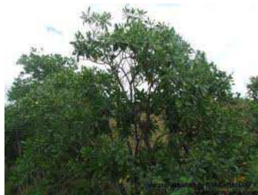
Image ou photo de l'Arbre

Note : Cette espèce ne doit pas être confondue avec l'espèce « Voacanga africana 1 » 2,3 .