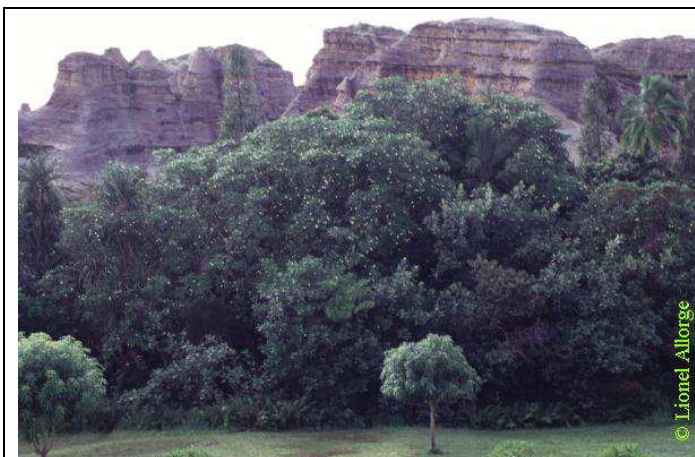
Voacanga thouarsii , dans l'Isalo (Madagascar)

Source : Fiche 904 - Voacanga thouarsii Roem. et Schult. ( Apocynaceae ), dans le CD-Rom Plantes médicinales de Madagascar de Pierre Boiteau et Lucile Allorge-Boiteau (voir références sur ce Cd-Rom, dans la partie " bibliographie " de cette fiche).