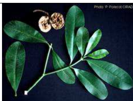
Feuilles et fruits.