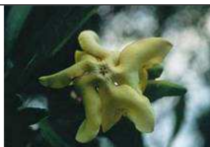
Fleur. Sources : 1) Plantes de Madagascar , Lucile Allorge, ULMER, 2008, page 47, 2) Les plantes médicinales malgaches et leurs utilisations , http://www.laplaneterevisitee.org/fr/109/les_plantes_medicinales_malgaches_et_leurs_utilisations_des_tradipraticiens_a_lindustrie_pharmaceut