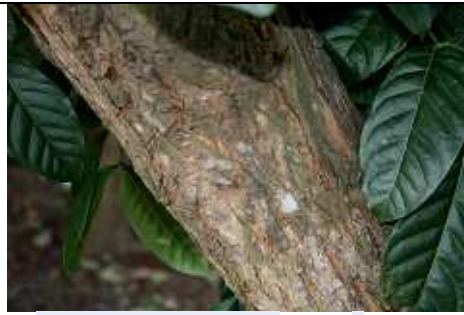
Vieille écorce et feuilles (Kolkata, Bengale occidentale, en Inde (Source : Wikipédia En).