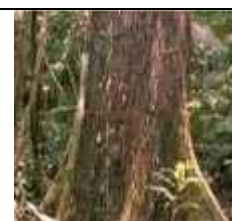
Géant de la forêt ayant échappé à l'extraction de bûcherons près de Maraba, Brésil (Anthony Simons) (Source : World Agroforestry Centre).