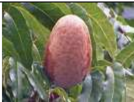
Fruit brun. Source: Swietenia macrophylla King. Ecology, silviculture and productivity (CIFOR).