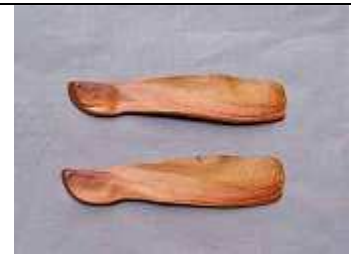
Graines de S. macrophylla