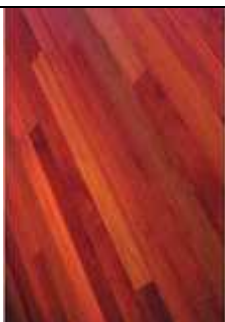
Parquet. Source: Swietenia macrophylla . King Ecology, silviculture and productivity