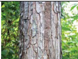
Ecorce d'un arbre S. macrophylla de 15 ans.