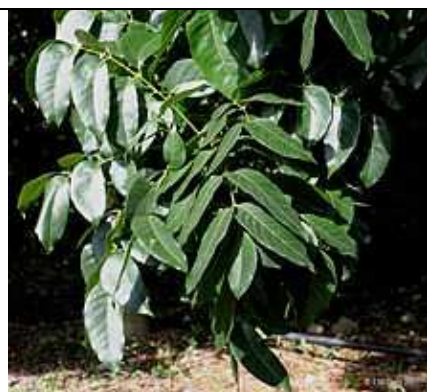
Feuilles à Kolkata, Bengale occidentale, Inde (Source : Wikipédia En).