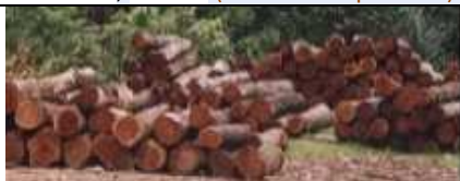
Grumes de S. macrophylla (Maraba, Brazil (Anthony Simons) (Source : World Agroforestry Centre).