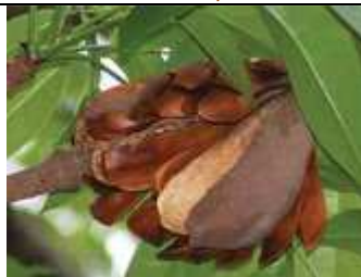
Capsule de S. macrophylla montrant l'arrangement interne des graines ailées.