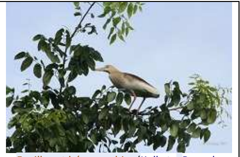
Feuilles et héron crabier (Kolkata, Bengale occidentale, en Inde (Source : Wikipédia En).