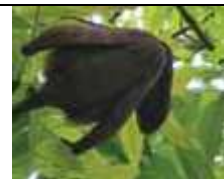
Fruit. Source: Swietenia macrophylla . King Ecology, silviculture and productivity (CIFOR).