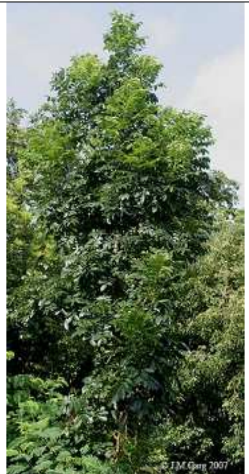
Jeune arbre à Kolkata , Bengale occidentale , en Inde.

Régions d'introduction connues : Largement cultivée dans les régions tropicales à la fois sur une "échelle de recherche" et que de vastes plantations [en Asie et dans le Pacifique] [1].