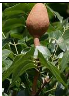
Branche avec fruits et feuilles, au niveau de la canopée ( Kolkata, Bengale occidentale, Inde ) (Source : Wikipédia En).