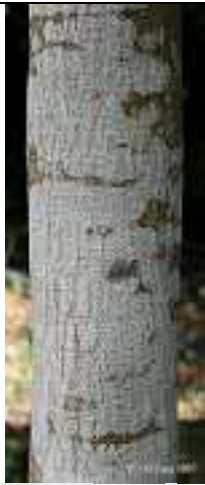
Jeune écorce (Kolkata, Bengale occidentale, en Inde.