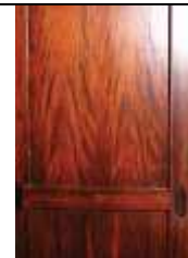
Porte. Source: Swietenia macrophylla . King Ecology, silviculture and productivity (CIFOR).