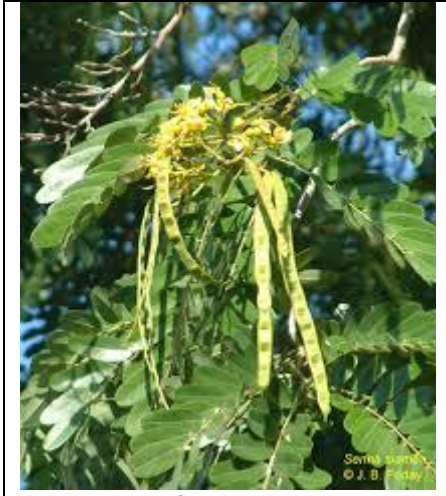
En fleur. Source : http://www.hear.org/pier/imagepages/singles/senna_siamea_lf_flwr.htm