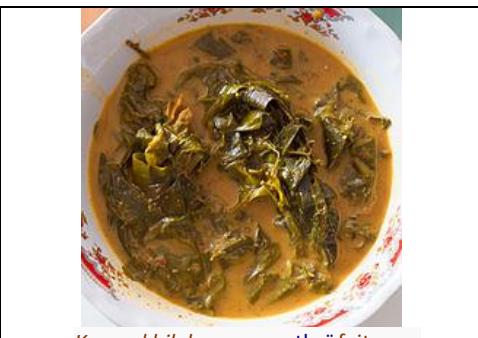
. Kaeng khilek , un curry thaï fait avec des feuilles et boutons de fleurs de kassod (Cassia du Siam).