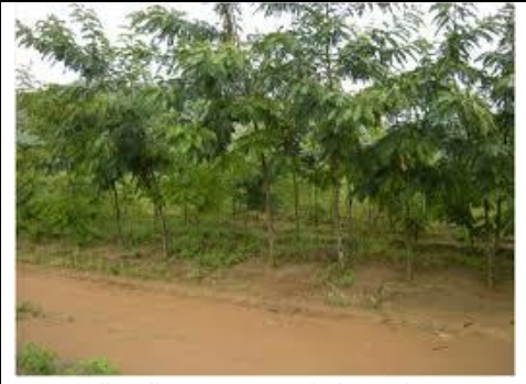
Parcelle villageoise, pour le bois, de Senna siamea , Kapatakafinye Village, dans la zone frontalière de Nyika National Park.