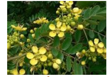
Source : http://www.centralafricanplants.senckenberg.de/root/index.php?page_id=34&id=3056